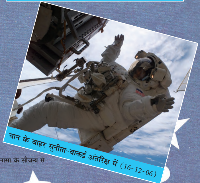
यान के बाहर सुनीता-वाकई अंतरिक्ष में (16-12-06)