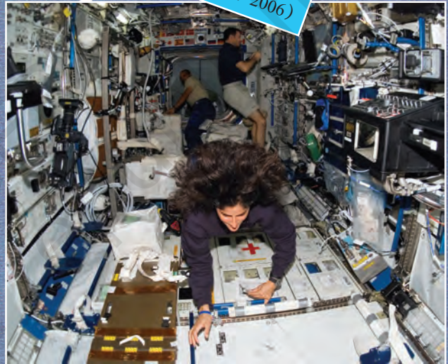
बाल खड़े के खड़े काम करते हुए भी न करें परेशान (13-12-06)