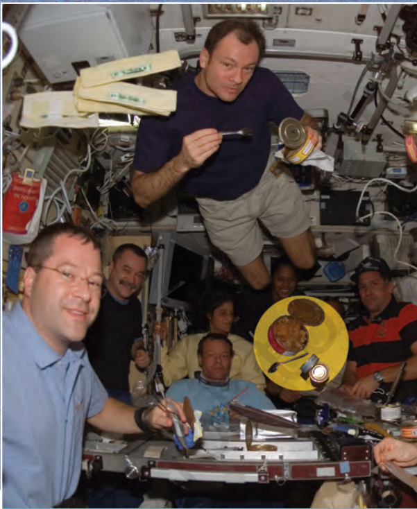
यह खाना कहाँ उड़ा जा रहा है! (11-12-2006)