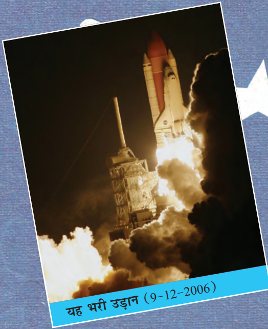
यह भारी उड़ान (9-12-2006)