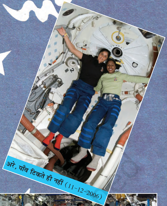
अरे, पाँव टिकते ही नहीं (11-12-2006)