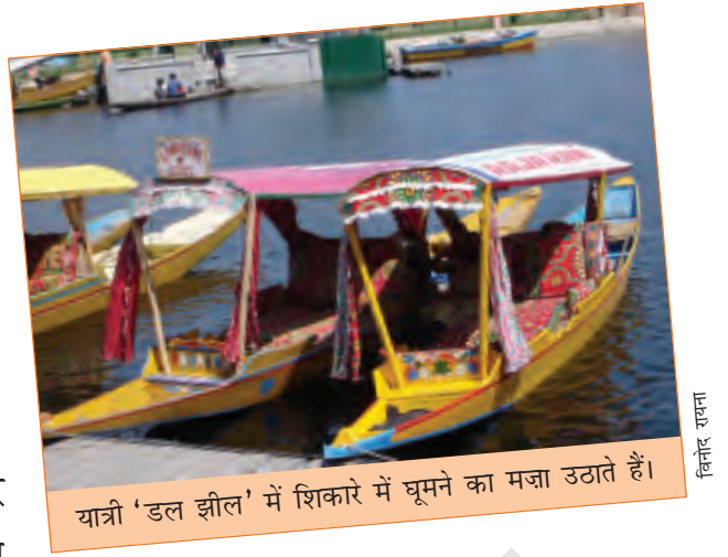
यात्री 'डल झील' में शिकारे में घूमने का मजा उठाते हैं।

अपने सफ़र की शुरुआत पर निकलने से पहले मैंने कभी सोचा भी न था कि एक ही राज्य में मुझे इतनी तरह के घर और लोगों के रहन-सहन के तरीके देखने को मिलेंगे। लेह में एक अनुभव था दुनिया की चोटी पर रहने का और श्रीनगर में अनुभव था पानी पर रहने का। इन इलाकों में घर भी ऐसे खास थे जो वहाँ के मौसम के अनुकूल थे।