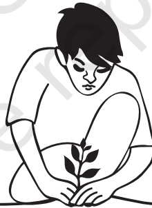
पेड़-पौधों की देखभाल