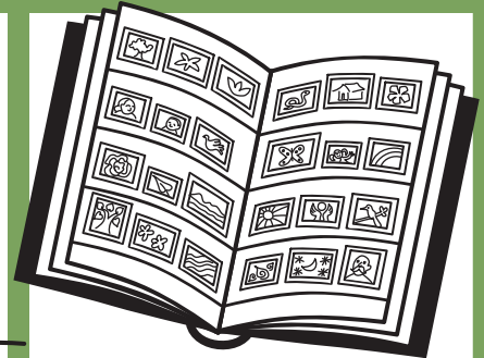
डाक-टिकट इकट्ठे करना