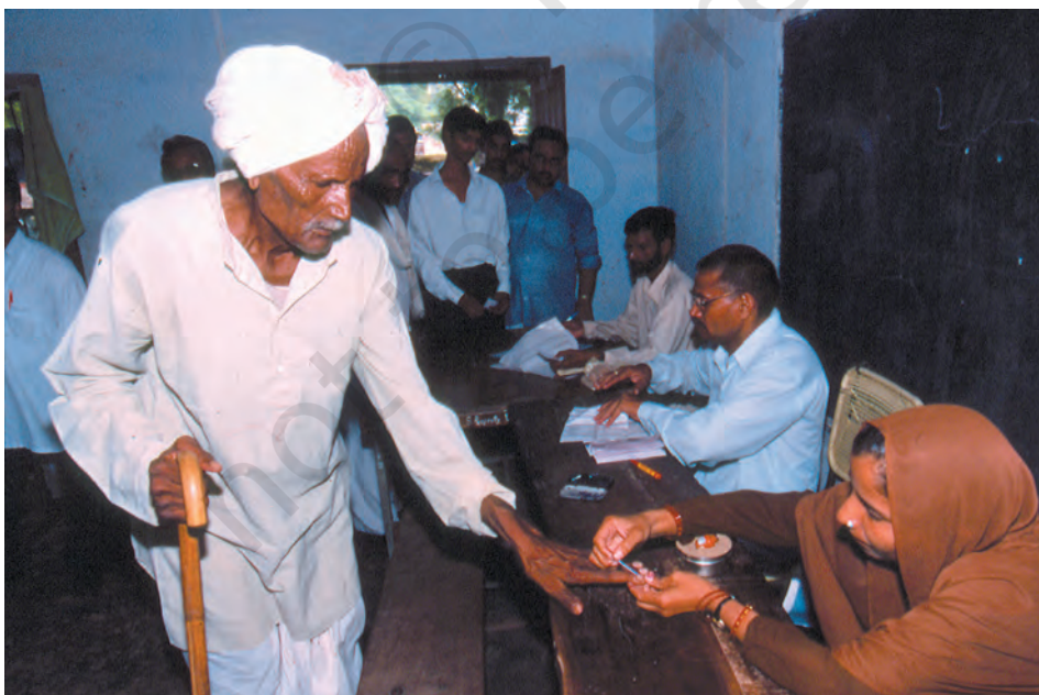
मतदान के समय मतदाता की उँगली पर स्याही से निशान लगाया जाता है ताकि वह केवल एक वोट दे सके – ग्रामीण मतदान केंद्र का दृश्य

लोकतंत्र में मूलभूत विचार यह है कि लोग नियमों को बनाने में भागीदार बनकर खुद ही शासन करें। आज के समय में लोकतांत्रिक सरकार को प्रायः प्रतिनिधि लोकतंत्र कहते हैं। प्रतिनिधि लोकतंत्र में लोग सीधे भाग नहीं लेते हैं, बल्कि चुनाव की प्रक्रिया के द्वारा अपने प्रतिनिधि को चुनते हैं। ये प्रतिनिधि मिलकर