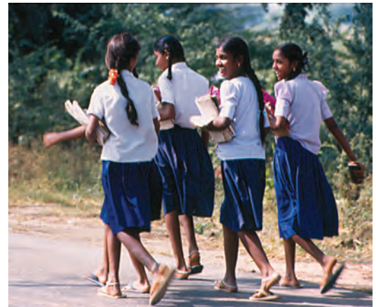
लड़कियाँ स्कूल जाते हुए समूह बनाकर चलना क्यों पसंद करती हैं?

आपके बड़े होने के अनुभव, सामोआ के बच्चों और किशोरों के अनुभव से किस प्रकार भिन्न हैं? इन अनुभवों में वर्णित क्या कोई ऐसी बात है, जिसे आप अपने बड़े होने के अनुभव में शामिल करना चाहेंगे?