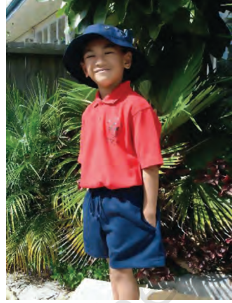
कक्षा सात का एक सामोआ छात्र अपने विद्यालय की वर्दी में।

कक्षा 6 में आने के बाद लड़के और लड़कियाँ अलग-अलग स्कूलों में जाते थे। लड़कियों के स्कूल, लड़कों के स्कूल से बिलकुल