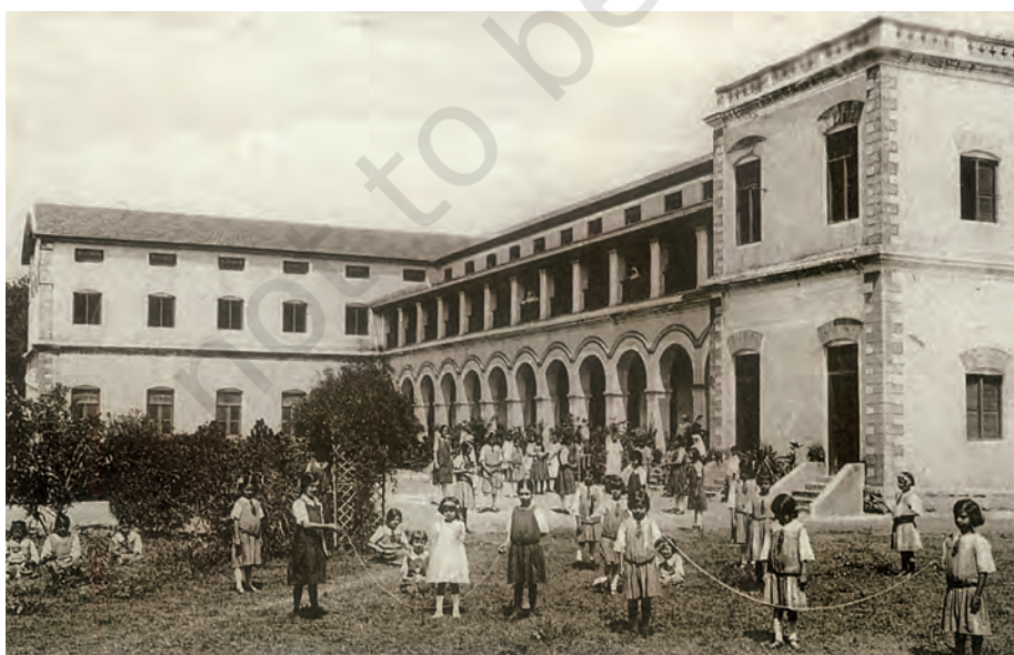
चित्र 12 - कोयम्बटूर के एक प्रचारक स्कूल में खेल रहे बच्चे, बीसवीं सदी का प्रारंभ।

इस प्रकार, बहुत सारे लोग इस बारे में सोचने लगे थे कि एक राष्ट्रीय शिक्षा प्रणाली की रूपरेखा क्या होनी चाहिए। कुछ लोग अंग्रेजों द्वारा स्थापित की गई व्यवस्था में परिवर्तन चाहते थे। उनका मानना था कि इसी व्यवस्था को इस तरह फैलाया जाए कि उसमें ज़्यादा से ज़्यादा लोगों को पढ़ने के मौके मिलें। इसके विपरीत बहुत सारे लोग ऐसे भी थे जो एक वैकल्पिक व्यवस्था चाहते थे ताकि लोगों को सच्चे अर्थों में राष्ट्रीय संस्कृति की शिक्षा दी जा सके। कौन तय करे कि सच्चे अर्थों में राष्ट्रीय क्या होता है? इस “राष्ट्रीय शिक्षा” की बहस स्वतंत्रता के बाद भी जारी रही।