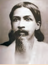
चित्र 9- अरविंदो घोष

अरविंदों घोष ने 15 जनवरी 1908 को बॉम्बे (मुंबई) में अपने एक सम्भाषण में राष्ट्रीय शिक्षा पर बोलते हुए कहा कि इसका लक्ष्य छात्रों में राष्ट्रीयता का भाव जागृत करना है। इसके लिए अपने पूर्वजों के साहसिक कार्यों पर गहराई से चिंतन करना आवश्यक होगा। शिक्षा को मातृ-भाषा में होना चाहिए ताकि यह अधिक-से-अधिक लोगों तक पहुँच सके। अरविंदो ने इस बात पर भी बल दिया कि यद्यपि छात्रों को अपने मूल के साथ जुड़े रहना चाहिए, फिर भी उनको आधुनिक वैज्ञानिक आविष्कारों तथा लोकप्रिय शासन व्यवस्था के संदर्भ में पश्चिमी देशों के अनुभव का भी भरपूर लाभ उठाना चाहिए। इसके अतिरिक्त छात्रों को कोई हस्तकला भी सीखनी चाहिए ताकि वे स्कूल छोड़ने पर यथा संभव रोजगार पा सकें।