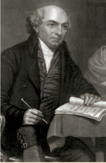
चित्र 6 - स्कॉटलैंड के ईसाई प्रचारक विलियम केरे जिसे सेरामपुर मिशन की स्थापना में मदद की।

उन्नीसवीं सदी में भारत में सक्रिय ईसाई प्रचारकों ने व्यावहारिक शिक्षा के पक्ष में दिए जा रहे तर्कों का घोर विरोध किया। प्रचारकों का मानना था कि शिक्षा का उद्देश्य लोगों के नैतिक चरित्र में सुधार लाना होता है और नैतिकता उत्थान केवल ईसाई शिक्षा के जरिए ही संभव है।