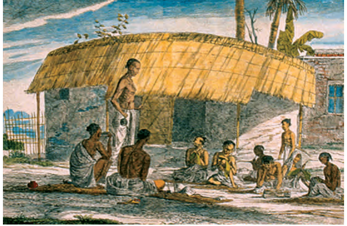
चित्र 8 - एक ग्रामीण पाठशाला।

एडम ने पाया कि यह लचीली प्रणाली स्थानीय आवश्यकताओं के लिए काफ़ी अनुकूल है। उदाहरण के लिए, फ़सलों की कटाई के समय कक्षाएँ बंद हो जाती थीं क्योंकि उस समय गाँव के बच्चे प्रायः खेतों में काम करने चले जाते थे। कटाई और अनाज निकल जाने के बाद पाठशाला दोबारा शुरू हो जाती थी। इसका परिणाम यह था कि साधारण काश्तकारों के बच्चे भी पढ़ाई कर सकते थे।