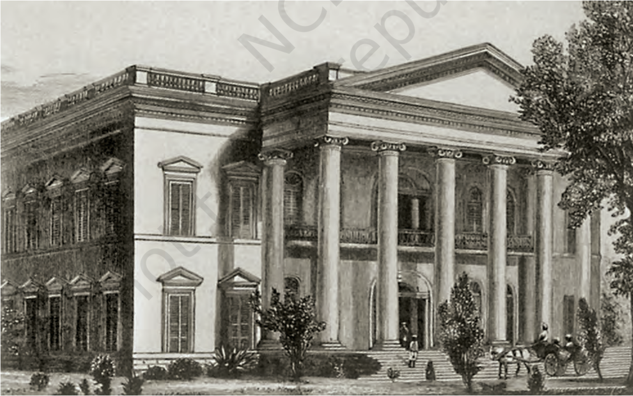
चित्र 7 - कलकत्ता के पास हुगली नदी के तट पर स्थित सेरामपुर कॉलेज।

उन्नीसवीं सदी के दौरान पूरे भारत में प्रचारक स्कूल खोले गए। परंतु 1857 के बाद भारत की ब्रिटिश सरकार प्रचारक शिक्षा को प्रत्यक्ष सहायता देने में आनाकानी करने लगी थी। सरकार को लगता था कि स्थानीय रीति-रिवाजों, व्यवहारों, मूल्य-मान्यताओं और धार्मिक विचारों से किसी भी तरह की छेड़छाड़ “देशी” लोगों को भड़का सकती है।