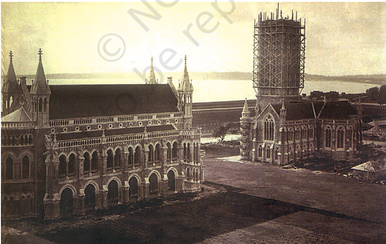
चित्र 5 - उन्नीसवीं सदी में बम्बई विश्वविद्यालय।

कल्पना कीजिए कि आप 1850 के दशक में जी रहे हैं। आपने वुड के नीतिपत्र (वुड्स डिस्पैच) के बारे में सुना है। इसके बारे में अपनी प्रतिक्रियाएँ लिखिए।