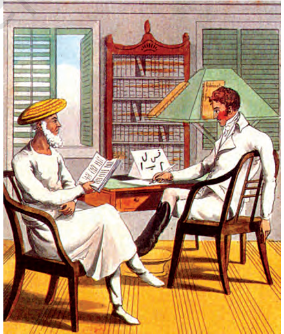
चित्र 1 - विलियम जोन्स फ़ारसी भाषा सीख रहे हैं।

सन् 1783 में विलियम जोन्स नाम के एक सज्जन कलकत्ता आए। उन्हें ईस्ट इंडिया कंपनी द्वारा स्थापित किए गए सुप्रीम कोर्ट में जूनियर जज के पद पर तैनात किया गया था। क़ानून का माहिर होने के साथ-साथ जोन्स एक भाषाविद भी थे। उन्होंने ऑक्सफ़र्ड में ग्रीक और लैटिन का अध्ययन किया था, वे फ्रेंच और अंग्रेज़ी जानते थे और अपने एक दोस्त से अरबी सीखने के अलावा फ़ारसी भी सीख चुके थे। कलकत्ता में