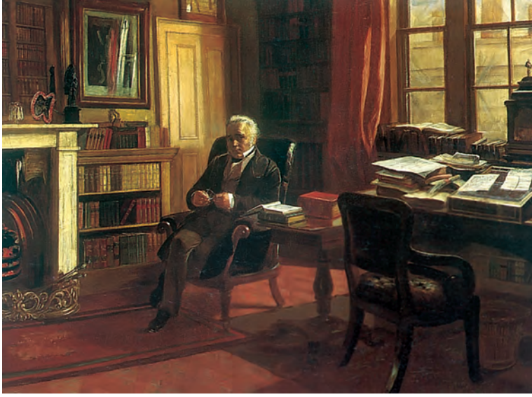
चित्र 4 - थॉमस बैबिंगटन मैकॉले और उनका अध्ययन कक्ष।