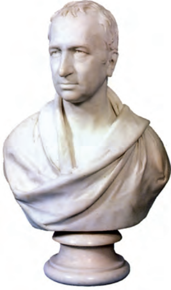
चित्र 2 - हेनरी टॉमस कोलब्रुक। वह संस्कृत तथा हिंदुत्व के प्राचीन धार्मिक ग्रंथों के विद्वान थे।

मदरसा - सीखने के स्थान को अरबी भाषा में मदरसा कहा जाता है। यह किसी भी तरह का स्कूल या कॉलेज या कोई और संस्थान हो सकता है।