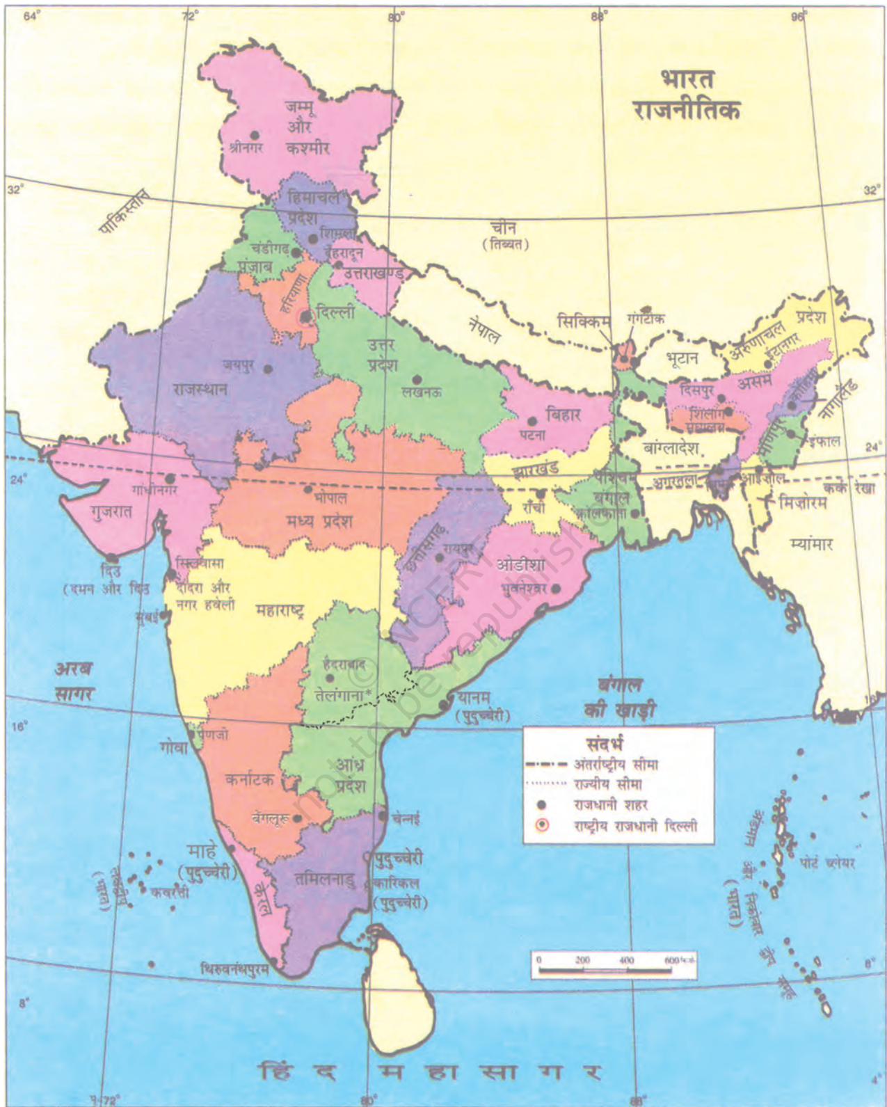
चित्र 7.2 : भारत का राजनीतिक मानचित्र

* जून 2014 में तेलंगाना भारत का 29वाँ राज्य बना