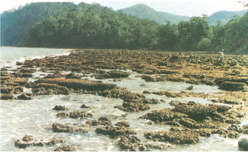
चित्र 7.4 : प्रवाल द्वीप