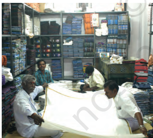
इरोड में एक दुकान

बाज़ार के दिनों में आपको वे बुनकर भी मिलेंगे, जो व्यापारियों के ऑर्डर के अनुसार कपड़ा बनाकर यहाँ लाते हैं। ये व्यापारी देश व विदेश के वस्त्र निर्माताओं और निर्यातकों को उनके ऑर्डर के अनुसार कपड़ा उपलब्ध कराते हैं। ये सूत खरीदते हैं और बुनकरों को निर्देश देते हैं कि किस प्रकार का कपड़ा तैयार किया जाना है। निम्नलिखित उदाहरण में हम देखेंगे कि यह कार्य कैसे होता है।