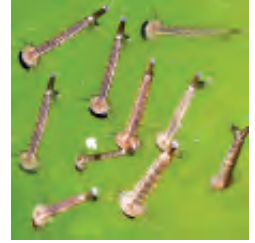
हैंड लेंस से देखने पर लारवे