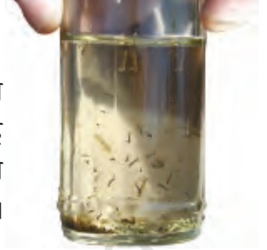
मच्छर के लारवे