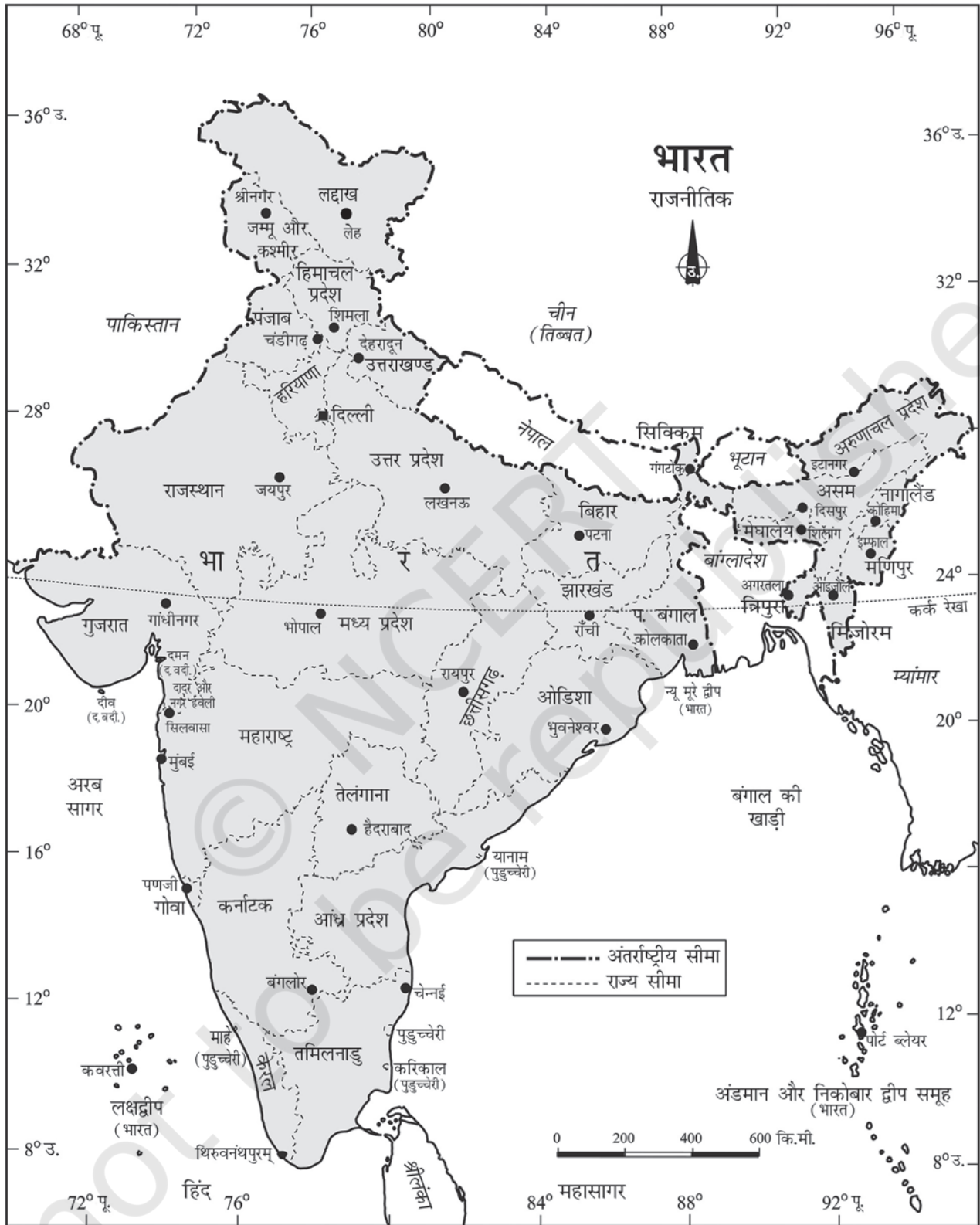
चित्र 1.1 : भारत : राजनीतिक