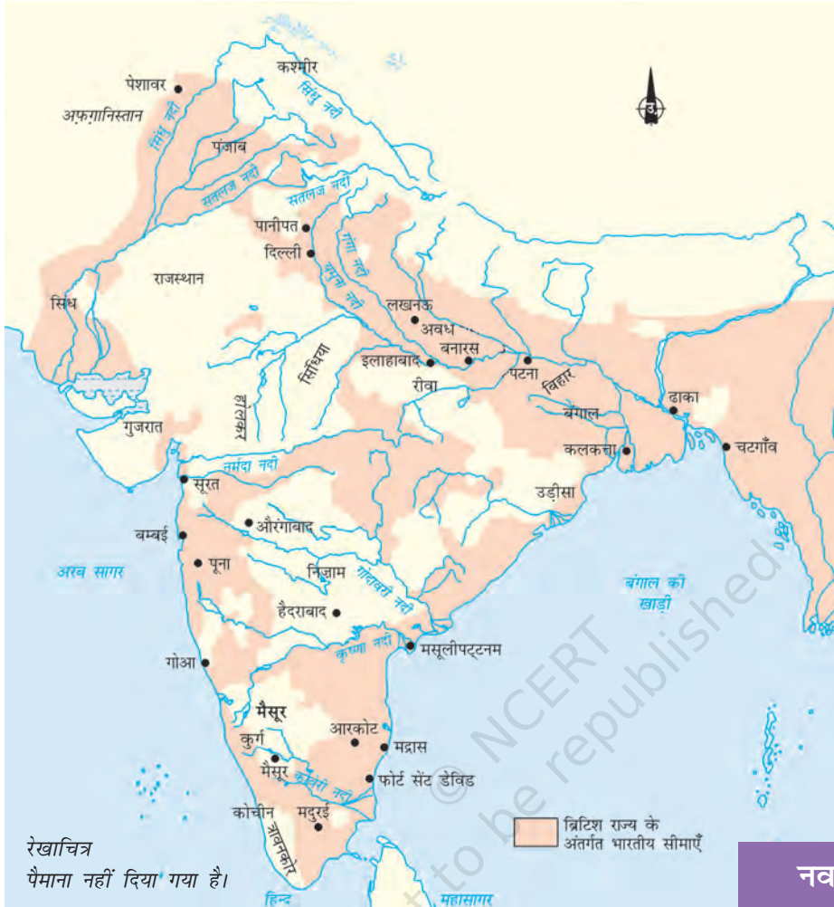
मानचित्र 1 1857 में भारतीय उपमहाद्वीप।