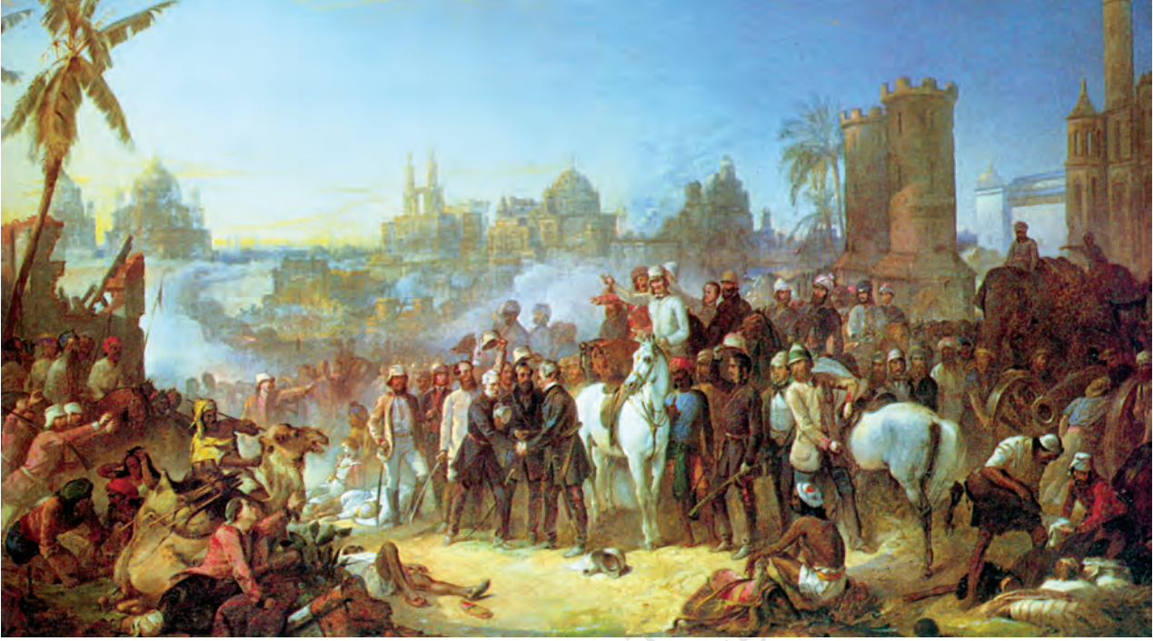
चित्र 11.10 “द रिलीफ ऑफ लखनऊ” चित्रकार टॉमस जोन्स बार्कर, 1859

विद्रोही टुकड़ियों ने लखनऊ पर घेरा डाल दिया तो लखनऊ के कमिश्नर हेनरी लॉरेंस ने ईसाइयों को इकट्ठा किया और बेहद सुरक्षित रेजीडेंसी में पनाह ले ली। बाद में लॉरेंस तो मारा गया किंतु कर्नल इंगलिस के नेतृत्व में रेजीडेंसी सुरक्षित रहा। 25 सितंबर को जेम्स ऑट्टम और हेनरी हेवलाक वहाँ पहुँचे, उन्होंने विद्रोहियों को तितर-बितर कर दिया और ब्रिटिश टुकड़ियों को नयी मजबूती दी। 20 दिन बाद भारत में ब्रिटिश टुकड़ियों का नया कमांडर कॉलिन कैम्पबेल भारी तादाद में सेना लेकर वहाँ पहुँचा और उसने ब्रिटिश रक्षकसेना को घेरे से छुड़ाया। अंग्रेजों के बयानों में लखनऊ की घेरेबंदी उत्तरजीविता, बहादुराना प्रतिरोध और ब्रिटिश सत्ता की निर्विवाद विजय की कहानी बन गई।