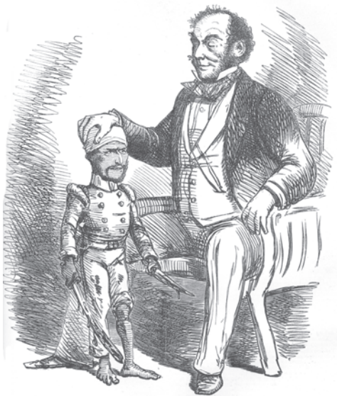
THE CLEMENCY OF CANNING.

हास्यपरक व्यंग्य की ब्रिटिश पत्रिका पन्च के पन्नों में प्रकाशित एक कार्टून में कैनिंग को एक भव्य नेक बुजुर्ग के रूप में दर्शाया गया। उसका