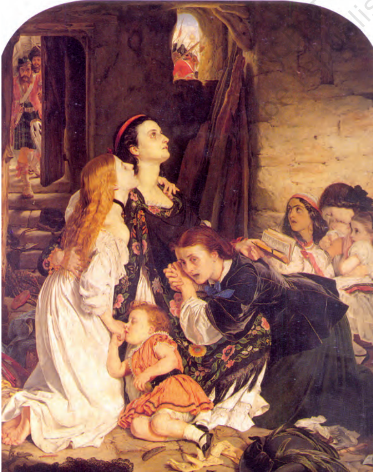
चित्र 11.11 “इन मेमोरियम”, चित्रकार जोज़ेफ़ नोएल पेटन, 1859

जोज़ेफ़ नोएल पेटन ने सैनिक विद्रोह के दो साल बाद “इन मेमोरियम” (‘स्मृति में’, चित्र 11.11) बनाई। इस चित्र में अंग्रेज़ औरतें और बच्चे एक घेरे में एक-दूसरे से लिपटे दिखाई देते हैं। वे लाचार और मासूम दिख रहे हैं, मानो एक भयानक घड़ी की आंशका में हैं।