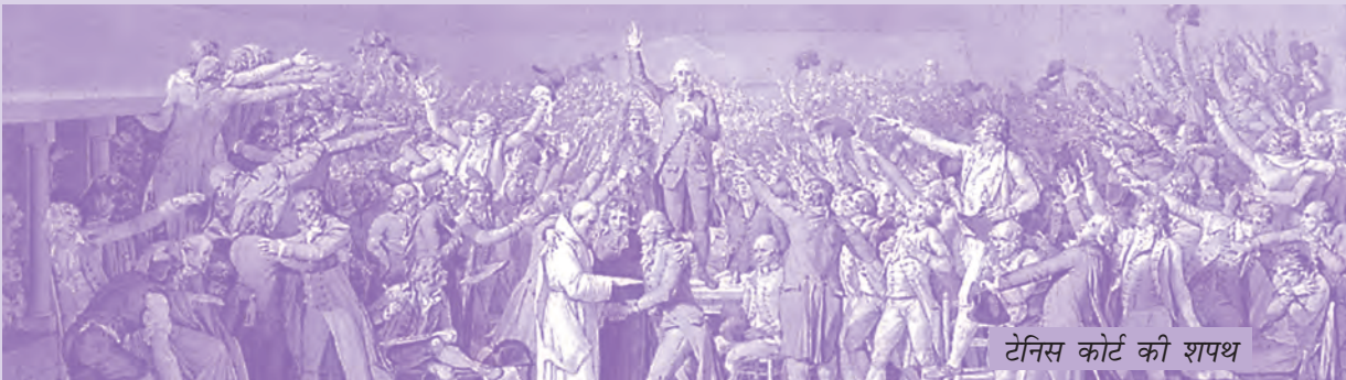
टैनिस कोर्ट की शपथ