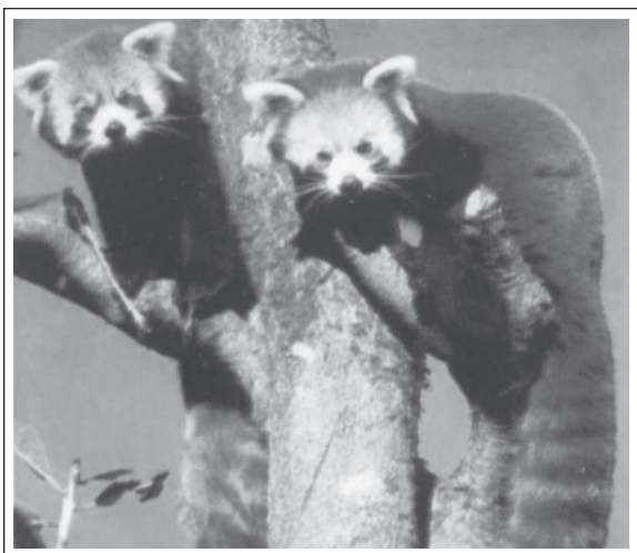
रेड पांडा - एक संकटापन्न प्रजाति