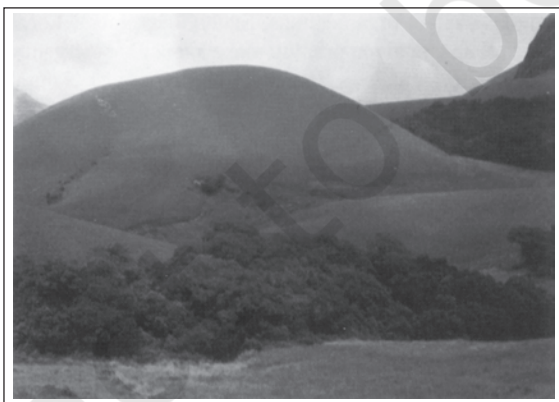
इंदिरा गाँधी नेशनल पार्क में (अन्नामलाई पश्चिमी घाट) घास भूमि एवं उष्ण कटिबंधीय शोला वन - पारितंत्रीय विविधता का एक उदाहरण

आपने पिछले अध्याय में पारितंत्रों के प्रकारों में व्यापक भिन्नता और प्रत्येक प्रकार के पारितंत्रों में होने वाले पारितंत्रीय प्रक्रियाएँ तथा आवास स्थानों की भिन्नता ही पारितंत्रीय विविधता बनाते हैं। पारितंत्रीय विविधता का परिसीमन करना मुश्किल और जटिल है, क्योंकि समुदायों (प्रजातियों का समूह) और पारितंत्र की सीमाएँ निश्चित नहीं हैं।