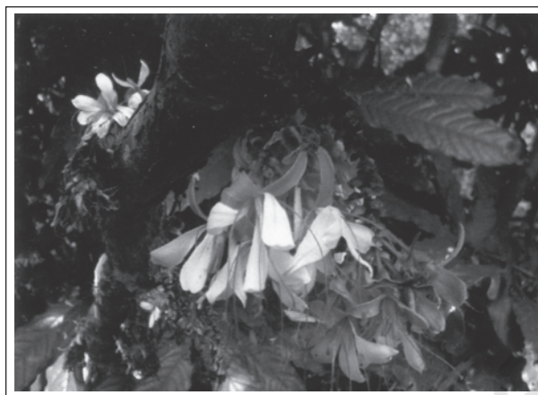
हमबोशिया डेकरेंस बेड- दक्षिण पश्चिमी घाट ( भारत ) की एक दुर्लभ प्रजाति

विश्व की सभी संकटापन्न प्रजातियों के बारे में (Red list) रेड लिस्ट के नाम से सूचना प्रकाशित करता है।