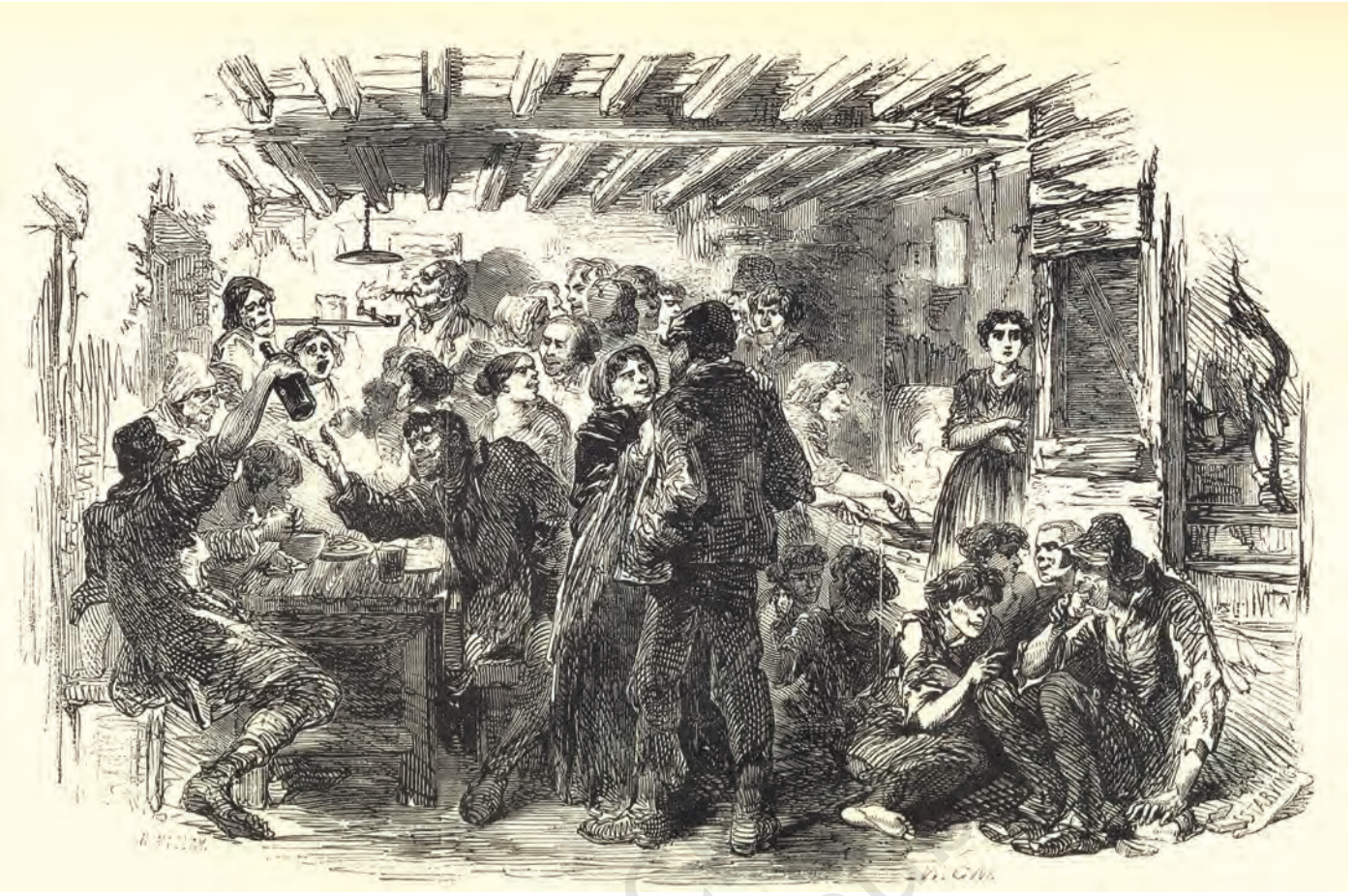
चित्र 1 - उन्नीसवीं शताब्दी के मध्य में लंदन के गरीबों की दशा उसी समय के एक व्यक्ति की दृष्टि से.

स्रोत : हेनरी मेह्यू, लंदन लेबर ऐन्ड लंदन पुअर, 1861