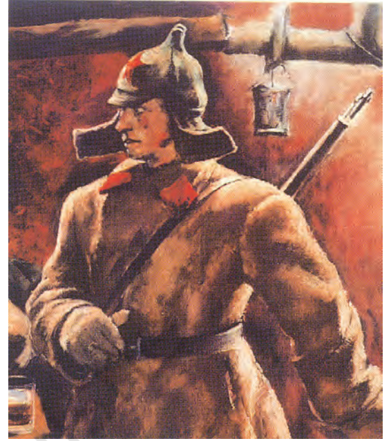
चित्र 12 - सोवियत टोपी (बुदियोनोव्का) पहने एक सिपाही.

बोल्शेविक पार्टी का नाम बदल कर रूसी कम्युनिस्ट पार्टी (बोल्शेविक) रख दिया गया। नवंबर 1917 में बोल्शेविकों ने संविधान सभा के लिए चुनाव कराए लेकिन इन चुनावों में उन्हें बहुमत नहीं मिल पाया। जनवरी 1918 में असेंबली ने बोल्शेविकों के प्रस्तावों को खारिज कर दिया और लेनिन ने असेंबली बर्खास्त कर दी। उनका मत था कि अनिश्चित परिस्थितियों में चुनी गई असेंबली के मुकाबले अखिल रूसी सोवियत कांग्रेस कहीं ज़्यादा लोकतांत्रिक संस्था है। मार्च 1918 में अन्य राजनीतिक सहयोगियों की असहमति के बावजूद बोल्शेविकों ने ब्रेस्ट लिटोव्स्क में जर्मनी से संधि कर ली। आने वाले सालों में बोल्शेविक पार्टी अखिल रूसी सोवियत कांग्रेस के लिए होने वाले चुनावों में हिस्सा लेने वाली एकमात्र पार्टी रह गई। अखिल रूसी सोवियत कांग्रेस को अब देश की संसद का दर्जा दे दिया गया था। रूस एक-दलीय राजनीतिक व्यवस्था वाला देश बन गया। ट्रेड यूनियनों पर पार्टी का नियंत्रण रहता था। गुप्तचर पुलिस (जिसे पहले चेका और बाद में ओजीपीयू तथा एनकेवीडी का नाम दिया गया) बोल्शेविकों की आलोचना करने वालों को दंडित करती थी। बहुत सारे युवा लेखक और कलाकार भी पार्टी की तरफ़ आकर्षित हुए क्योंकि वह समाजवाद और परिवर्तन के प्रति समर्पित थी। अक्टूबर 1917 के बाद ऐसे कलाकारों और लेखकों ने कला और वास्तुशिल्प के क्षेत्र में नए प्रयोग शुरू किए। लेकिन पार्टी द्वारा थोपी गई सेंसरशिप के कारण बहुत सारे लोगों का पार्टी से मोह भंग भी होने लगा था।