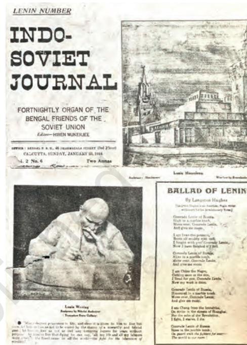
चित्र 20 - इंडो-सोवियत जर्नल का लेनिन विशेषांक. दूसरे विश्वयुद्ध के दौरान भारतीय कम्युनिस्टों ने सोवियत संघ के लिए जनमत निर्माण किया।