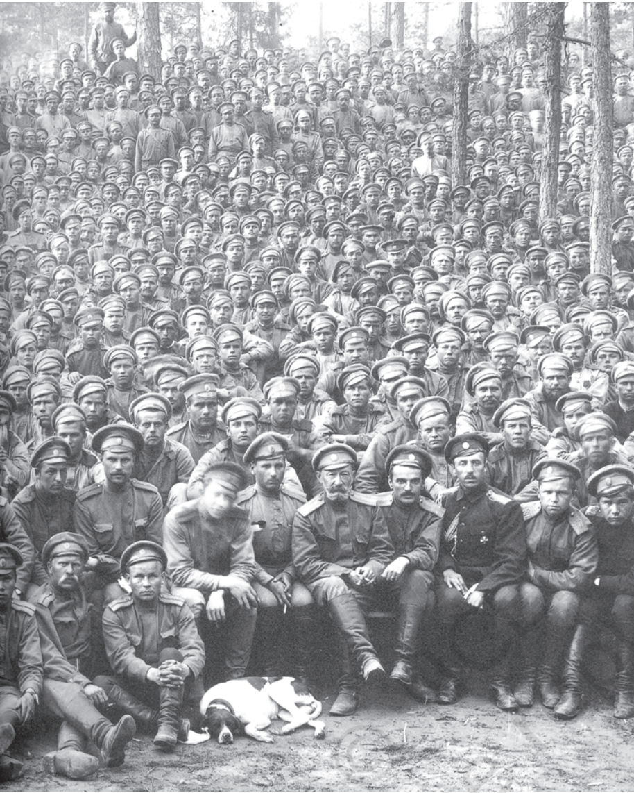
चित्र 7 - पहले विश्वयुद्ध के दौरान रूसी सिपाही। शाही रूसी सेना को 'रूसी स्टीमरोलर' कहा जाता था। यह दुनिया की सबसे बड़ी सशस्त्र सेना थी। जब इस सेना ने अपनी निष्ठा बदल कर क्रांतिकारियों को समर्थन देना शुरू कर दिया तो ज़ार की सत्ता भी ढह गई।

युद्ध से उद्योगों पर भी बुरा असर पड़ा। रूस के अपने उद्योग तो वैसे भी बहुत कम थे, अब तो बाहर से मिलने वाली आपूर्ति भी बंद हो गई क्योंकि बाल्टिक समुद्र में जिस रास्ते से विदेशी औद्योगिक सामान आते थे उस पर जर्मनी का कब्जा हो चुका था। यूरोप के बाकी देशों के मुकाबले रूस के औद्योगिक उपकरण ज़्यादा तेजी से बेकार होने लगे। 1916 तक रेलवे लाइनें टूटने लगीं। अच्छी सेहत वाले मर्दों को युद्ध में झोंक दिया गया। देश भर में मज़दूरों की कमी पड़ने लगी और ज़रूरी सामान बनाने वाली छोटी-छोटी वर्कशॉप्स ठप्प होने लगीं। ज़्यादातर अनाज सैनिकों का पेट भरने के लिए मोर्चे पर भेजा जाने लगा। शहरों में रहने वालों के लिए रोटी और आटे की किल्लत पैदा हो गई। 1916 की सर्दियों में रोटी की दुकानों पर अकसर दंगे होने लगे।