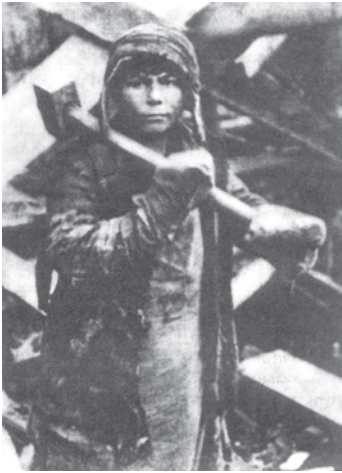
चित्र 16 - पहली पंचवर्षीय योजना के दौरान मैग्नीटोगोर्स्क का एक बच्चा। यह बच्चा सोवियत रूस के लिए काम कर रहा है।