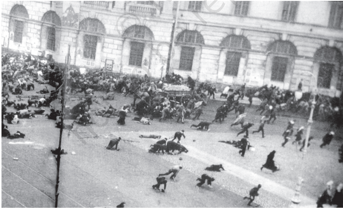
चित्र 10 - जुलाई के दिन.

17 जुलाई 1917 को बोल्शेविक समर्थक प्रदर्शनकारियों पर सेना द्वारा गोलीबारी का दृश्य।