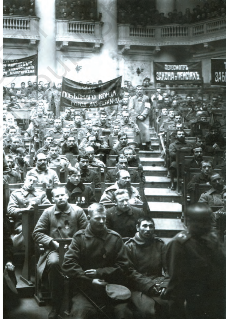
चित्र 8 - ड्यूमा में पेत्रोग्राद सोवियत की बैठक, फरवरी 1917.

बॉक्स 2 देखें और वर्तमान कैलेंडर के हिसाब से अंतर्राष्ट्रीय महिला दिवस की तिथि का पता लगाएँ।