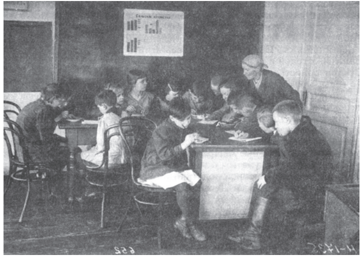
चित्र 15 - तीस के दशक में सोवियत रूस के एक स्कूल में पढ़ते बच्चे। बच्चे सोवियत अर्थव्यवस्था का अध्ययन कर रहे हैं।