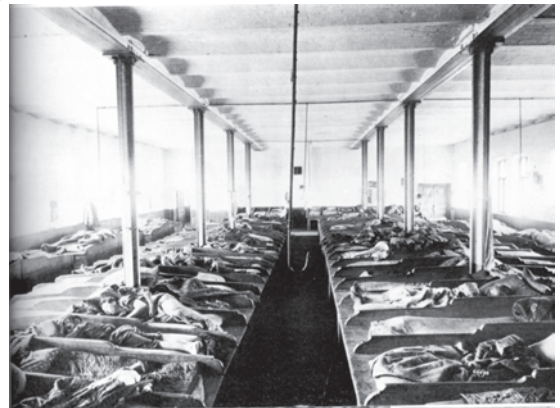
चित्र 6 - क्रांति-पूर्व रूस में एक डॉर्मिटरी में बने बंकर में सोते मजदूर, वे पालियों में बारी-बारी से सोते थे और परिवार को साथ नहीं रख सकते थे।