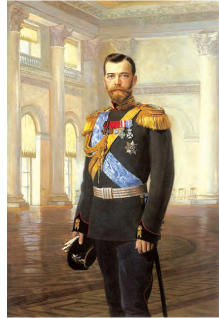
चित्र 3 - सेंट पीटर्सबर्ग स्थित विंटर पैलेस के व्हाइट हॉल में ज़ार निकोलस II, 1900. अर्नेस्ट लिपगार्ट (1847-1932) द्वारा चित्रित।

1914 में रूस और उसके पूरे साम्राज्य पर ज़ार निकोलस II का शासन था। मास्को के आसपास पड़ने वाले भूक्षेत्र के अलावा आज का फ़िनलैंड, लातविया, लिथुआनिया, एस्तोनिया तथा पोलैंड, यूक्रेन व बेलारूस के कुछ हिस्से रूसी साम्राज्य के अंग थे। यह साम्राज्य प्रशांत महासागर तक फैला हुआ था और आज के मध्य एशियाई राज्यों के साथ-साथ जॉर्जिया, आर्मेनिया व अज़रबैजान भी इसी साम्राज्य के अंतर्गत आते थे। रूस में ग्रीक ऑर्थोडॉक्स चर्च से उपजी शाखा रूसी ऑर्थोडॉक्स क्रिश्चियैनिटी को मानने वाले बहुमत