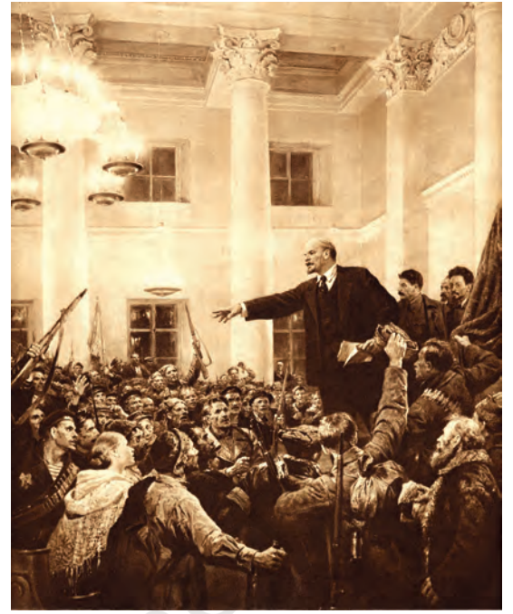
चित्र 9 - अप्रैल 1917 में मज़दूरों को संबोधित करते लेनिन की एक बोल्शेविक छवि.

गांवों में किसान और उनके समाजवादी क्रांतिकारी नेता भूमि पुनर्वितरण के लिए दबाव डालने लगे थे। इस काम के लिए भूमि समितियाँ बना दी गई थीं। सामाजिक क्रांतिकारियों से प्रेरणा और प्रोत्साहन लेते हुए जुलाई से सितंबर के बीच किसानों ने बहुत सारी ज़मीन पर कब्ज़ा कर लिया।