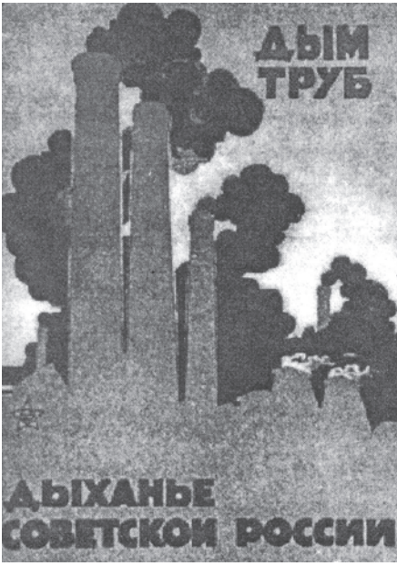
चित्र 14 - कारखानों को समाजवाद के प्रतीक की तरह माना जाता था। पोस्टर में लिखा है: 'चिमनियों से निकलता धुआँ ही सोवियत रूस की साँस है।'