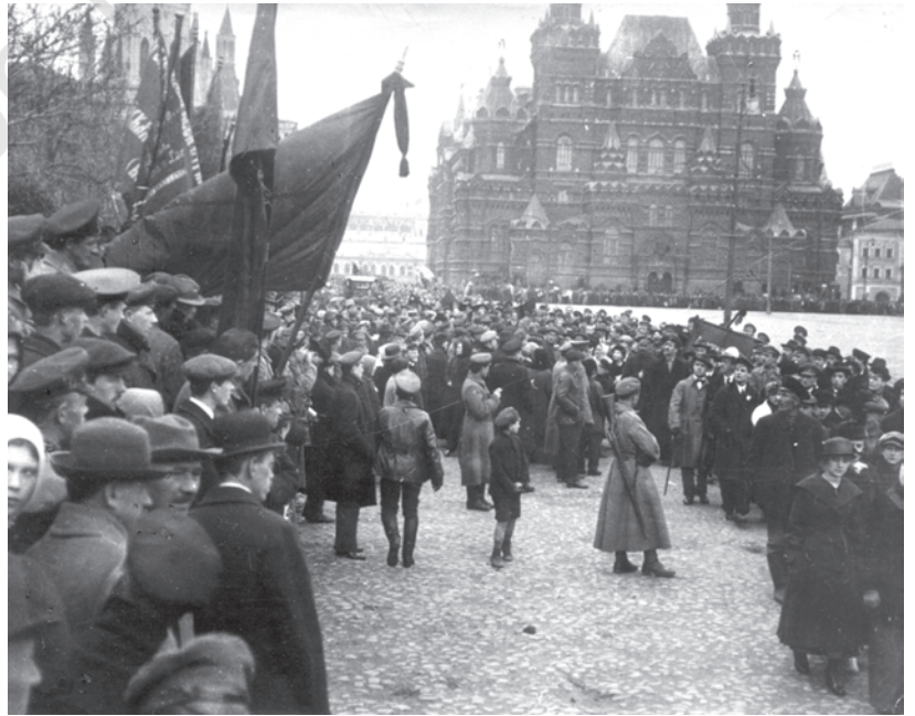
चित्र 13 - मास्को में मई दिवस का प्रदर्शन, 1918.