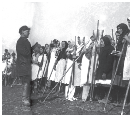
चित्र 19 - विशाल सामूहिक फ़ार्मों में काम करने के लिए जुटी किसान औरतें.

वी. सोकोलोव (सं.), ऑब्लचेस्त्वो I व्लास्त, वी 1930-ये गोदी।