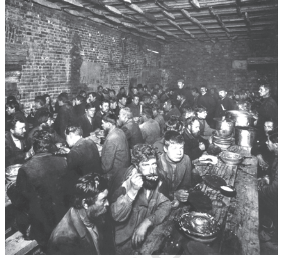
चित्र 5 - युद्ध से पहले सेंट पीटर्सबर्ग में बेरोज़गार किसान, बहुत सारे लोग धर्मार्थ लंगरों में खाना खाते थे और खस्ताहाल मकानों में रहते थे।

सामाजिक स्तर पर मजदूर बँटे हुए थे। कुछ मजदूर अपने मूल गाँवों के साथ अभी भी गहरे संबंध बनाए हुए थे। बहुत सारे मजदूर स्थायी रूप से शहरों में ही बस चुके थे। उनके बीच योग्यता और दक्षता के स्तर पर भी काफी फ़र्क था। सेंट पीटर्सबर्ग के एक धातु मजदूर ने कहा था : 'धातुकर्मी मजदूरों में खुद को साहब मानते थे। उनके काम में ज्यादा प्रशिक्षण और निपुणता की जरूरत जो रहती थी...।' 1914 में फ़ैक्ट्री मजदूरों में औरतों की संख्या 31 प्रतिशत थी लेकिन उन्हें पुरुष मजदूरों के मुकाबले कम वेतन मिलता था (मर्दों की तनख्वाह के मुकाबले आधे से तीन-चौथाई तक)। मजदूरों के बीच मौजूद फ़ासला उनके पहनावे और व्यवहार में भी साफ़ दिखाई देता था। यद्यपि कुछ मजदूरों ने बेरोज़गारी या आर्थिक संकट के समय एक-दूसरे की मदद करने के लिए संगठन बना लिए थे लेकिन ऐसे संगठन बहुत कम थे।