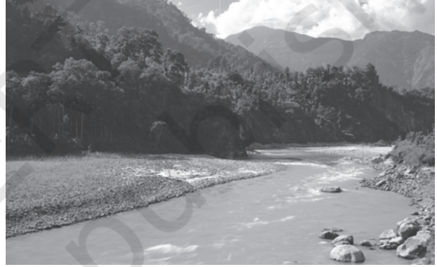
चित्र 3.1 : पर्वतीय क्षेत्र की एक नदी

दिशा से दूसरी दिशा में बहने का कारण बता सकते हैं? उत्तर में हिमालय तथा दक्षिण में पश्चिमी घाट