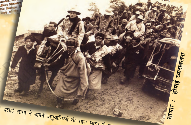
दलाई लामा ने अपने अनुयायियों के साथ भारत से शरण की माँग की।

चीन ने 'स्वायत्त तिब्बत क्षेत्र' बनाया है और इस इलाके को वह चीन का अभिन्न अंग मानता है। तिब्बती जनता चीन के इस दावे को नहीं मानती कि तिब्बत चीन का अभिन्न अंग है। ज्यादा से ज्यादा संख्या में चीनी बाशिंदों को तिब्बत लाकर वहाँ बसाने की चीन की नीति कि तिब्बती जनता ने विरोध किया। तिब्बती चीन के इस दावे को भी नकारते हैं कि तिब्बत को स्वायत्तता दी गई है। वे मानते हैं कि तिब्बत की पारंपरिक संस्कृति और धर्म को नष्ट करके चीन वहाँ साम्यवाद फैलाना चाहता है।