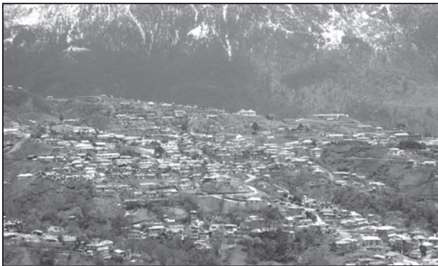
चित्र 4.1 : उत्तर-पूर्वी राज्यों में गुच्छित बस्तियाँ

गुच्छित ग्रामीण बस्ती घरों का एक संहत अथवा संकुलित रूप से निर्मित क्षेत्र होता है। इस प्रकार के गाँव में रहन-सहन का सामान्य क्षेत्र स्पष्ट और चारों ओर फैले खेतों, खलिहानों और चरागाहों से पृथक होता है। संकुलित निर्मित क्षेत्र और इसकी मध्यवर्ती गलियाँ कुछ जाने-पहचाने प्रारूप अथवा ज्यामितीय आकृतियाँ प्रस्तुत करते हैं जैसे कि आयताकार, अरीय, रैखिक इत्यादि। ऐसी बस्तियाँ प्रायः उपजाऊ जलोढ़ मैदानों और उत्तर-पूर्वी राज्यों में पाई जाती हैं। कई बार लोग सुरक्षा अथवा प्रतिरक्षा कारणों से संहत गाँवों में रहते हैं, जैसे कि मध्य भारत