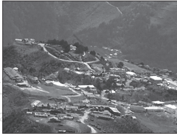
चित्र 4.2 : अर्ध-गुच्छित बस्तियाँ

अर्ध-गुच्छित अथवा विखंडित बस्तियाँ परिक्षिप्त बस्ती के किसी सीमित क्षेत्र में गुच्छित होने की प्रवृत्ति का परिणाम है। अधिकतर ऐसा प्रारूप किसी बड़े संहत गाँव के संपृथकन अथवा विखंडन के परिणामस्वरूप भी उत्पन्न हो सकता है। ऐसी स्थिति में ग्रामीण समाज के एक अथवा अधिक वर्ग स्वेच्छा से अथवा बलपूर्वक मुख्य गुच्छ अथवा गाँव से थोड़ी दूरी पर रहने लगते हैं। ऐसी स्थितियों में, आमतौर पर जमींदार और अन्य प्रमुख समुदाय मुख्य गाँव के केंद्रीय भाग पर