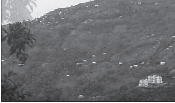
चित्र 4.3 : नागालैंड में परिक्षिप्त बस्तियाँ

भारत में परिक्षिप्त अथवा एकाकी बस्ती प्रारूप सुदूर जंगलों में एकाकी झोंपड़ियों अथवा कुछ झोंपड़ियों की पल्ली अथवा छोटी पहाड़ियों की ढालों पर खेतों अथवा चरागाहों के रूप में दिखाई पड़ता है। बस्ती का चरम विक्षेपण प्रायः भू-भाग और