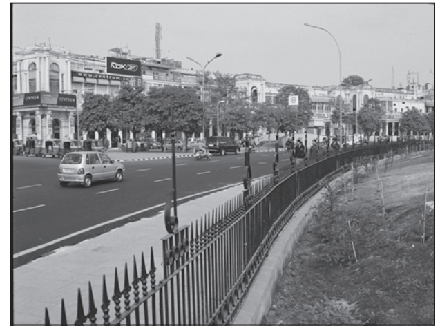
चित्र 4.4 : आधुनिक शहर का एक दृश्य

अंग्रेजों और अन्य यूरोपियों ने भारत में अनेक नगरों का विकास किया। तटीय स्थानों पर अपने पैर जमाते हुए उन्होंने सर्वप्रथम सूरत, दमन, गोआ, पांडिचेरी इत्यादि जैसे व्यापारिक पत्तन