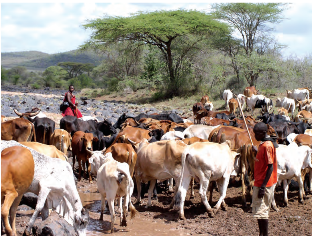
चित्र 15 - मासाई नाम 'मा' शब्द से निकला है। मा-साई का मतलब होता है 'मेरे लोग'। परंपरागत रूप से मासाई घुमंतू और चरवाहा समुदाय के लोग होते हैं जो अपनी आजीविका के लिए दूध और मांस पर आश्रित रहते हैं। ऊँचे तापमान और कम वर्षा के कारण यहाँ शुष्क, धूल भरे और बेहद गर्म हालात रहते हैं। इस अर्ध-शुष्क विषुववृत्तीय इलाके में सूखे के हालात सामान्य हैं। ऐसे समय में बहुत सारे जानवर मर जाते हैं।