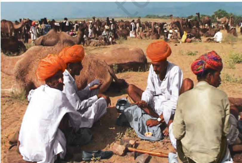
चित्र 8 - पुष्कर का ऊँट मेला.

आइए, अब देखें कि औपनिवेशिक शासन के दौरान यानी अंग्रेज़ों के ज़माने में चरवाहों का जीवन किस तरह बदला?