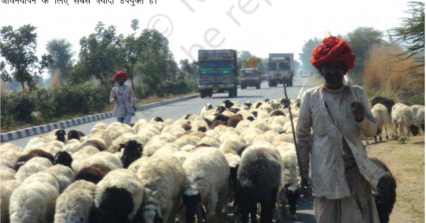
चित्र 18 - जयपुर राजमार्ग पर राइका गड़रिये.

चरवाहे अतीत के अवशेष नहीं हैं। वे ऐसे लोग नहीं हैं जिनके लिए आज की आधुनिक दुनिया में कोई जगह नहीं है। पर्यावरणवादी और अर्थशास्त्री अब इस बात को काफ़ी गंभीरता से मानने लगे हैं कि घुमंतू चरवाहों की जीवनशैली दुनिया के बहुत सारे पहाड़ी और सूखे इलाकों में जीवनयापन के लिए सबसे ज्यादा उपयुक्त है।