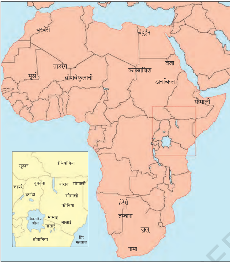
चित्र 13 - अफ्रीका के चरवाहा समुदाय.

छोटी तस्वीर (इनसेट) में कीनिया और तंज़ानिया में मासाइयों का इलाका दर्शाया गया है।