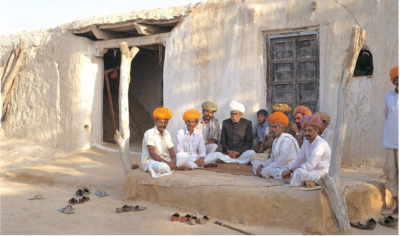
चित्र 9 - मारू राइकाओं की वंशावली बताने वाला.

वंशावली बताने वाला समुदाय का इतिहास बताता है। इस तरह की मौखिक परंपराओं से चरवाहा समुदायों को अपनी पहचान का भाव मिलता है। इन परंपराओं से हम यह पता लगा सकते हैं कि कोई समूह अपने अतीत को किस तरह देखता है।