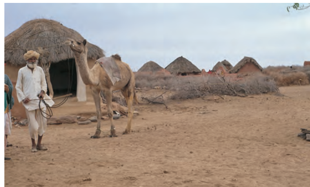
चित्र 6 - अपने ऊँट के साथ एक ऊँटपालक.

यह राजस्थान में जैसलमेर के निकट थार का रेगिस्तान है। इस इलाके के ऊँट पालकों को मारू (रेगिस्तान) राइका और उनकी बस्ती को ढंडी कहा जाता है।