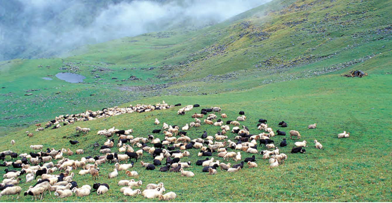
चित्र 1 - पूर्वी गढ़वाल के बुग्याल में चरती भेड़ें.

बुग्याल ऊँचे पहाड़ों पर 12,000 फुट से भी ज्यादा ऊँचाई पर स्थित विशाल प्राकृतिक चरागाह होते हैं। जाड़ों में ये बर्फ से ढके रहते हैं और अप्रैल के बाद हरे-भरे हो जाते हैं। इस समय पहाड़ियों की तलहटी तरह-तरह की घास, जड़ों और जड़ी-बूटियों से भरी रहती है। मॉनसून तक इन चरागाहों में घनी हरियाली छा जाती है और चारों तरफ फूल ही फूल दिखाई देने लगते हैं।