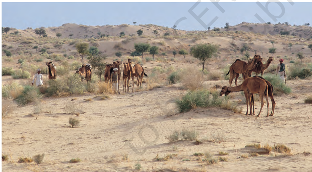
चित्र 5 - पश्चिमी राजस्थान के थार रेगिस्तान में चरते राइका समुदाय के ऊँट.

धंगर महाराष्ट्र का एक जाना-माना चरवाहा समुदाय है। बीसवीं सदी की शुरुआत में इस समुदाय की आबादी लगभग 4,67,000 थी। उनमें से ज्यादातर गड़रिये या चरवाहे थे हालाँकि कुछ लोग कम्बल और चादरें भी बनाते थे जबकि कुछ भैंस पालते थे। धंगर गड़रिये बरसात के दिनों में महाराष्ट्र के मध्य पठारों में रहते थे। यह एक अर्ध-शुष्क इलाका था जहाँ बारिश बहुत कम होती थी और मिट्टी भी खास उपजाऊ नहीं थी। चारों तरफ सिर्फ कंटीली झाड़ियाँ होती थीं। बाजरे जैसी सूखी फ़सलों के अलावा यहाँ और कुछ नहीं उगता था। मॉनसून में यह पट्टी धंगरों के जानवरों के लिए एक विशाल चरागाह बन जाती थी। अक्टूबर के आसपास धंगर बाजरे की कटाई करते थे और चरागाहों की तलाश में पश्चिम की तरफ चल पड़ते थे। करीब महीने भर पैदल चलने के बाद वे अपने रेवड़ों के साथ कोंकण के इलाके में जाकर डेरा डाल देते थे। अच्छी बारिश और उपजाऊ मिट्टी की बदौलत इस इलाके में खेती खूब होती थी। कोंकणी किसान भी इन चरवाहों का दिल खोलकर स्वागत करते थे। जिस समय धंगर कोंकण पहुँचते थे उसी समय कोंकण के किसानों को खरीफ़ की फ़सल काट कर अपने खेतों को रबी की फ़सल के लिए दोबारा उपजाऊ बनाना होता था।