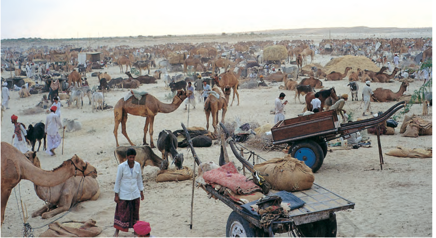
चित्र 7 - पश्चिमी राजस्थान में बलोतरा स्थित ऊँट मेला.

ऊँटपालक यहाँ ऊँटों की खरीद-फ़रोखा के लिए आते हैं। मेले में मारू राइका ऊँटों के प्रशिक्षण में अपनी महारत का भी प्रदर्शन करते हैं। इस मेले में गुजरात से घोड़े भी लाए जाते हैं।