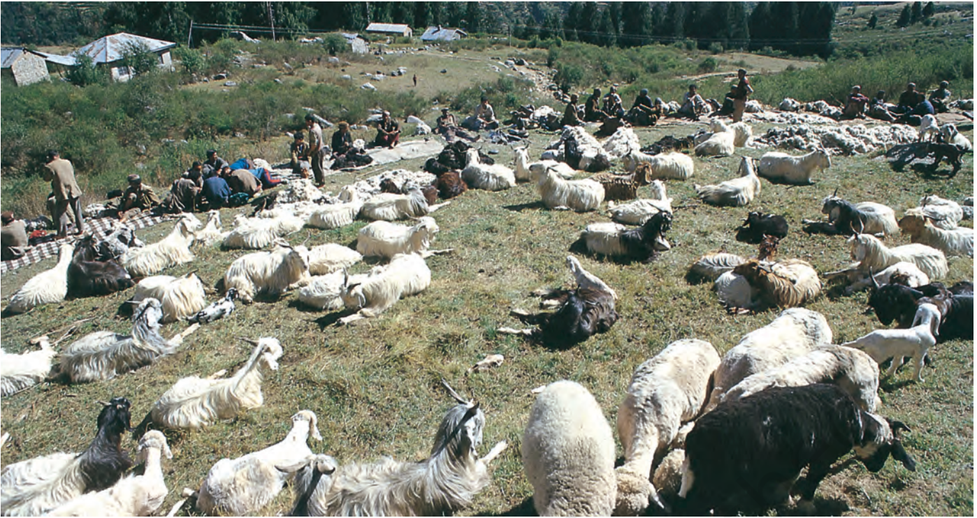
चित्र 3 - ऊन उतरने का इंतज़ार। हिमाचल प्रदेश स्थित पालमपुर के पास उहल घाटी।

और स्पीति के गाँवों में एक बार फिर कुछ समय के लिए रुकते। इस बीच वे गर्मियों की फ़सलें काटते और सर्दियों की फ़सलों की बुवाई करके आगे बढ़ जाते। यहाँ से वे अपने रेवड़ लेकर शिवालिक की पहाड़ियों में जाड़ों वाले चरागाहों में चले जाते और अगली अप्रैल में भेड़-बकरियाँ लेकर वे दोबारा गर्मियों के चरागाहों की तरफ़ खाना हो जाते।