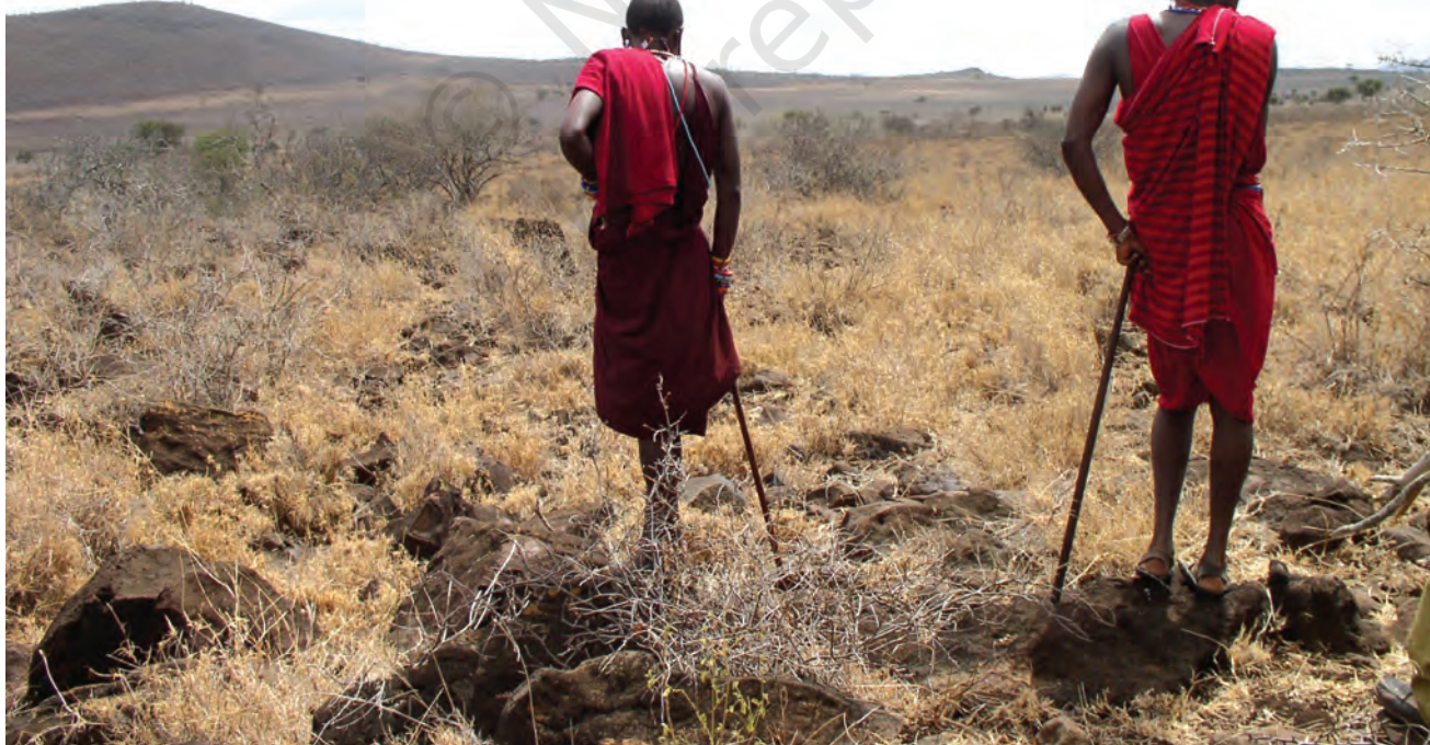
चित्र 14 - घास के बिना पशु (मवेशी, बकरियाँ और भेड़ें) कुपोषण का शिकार हो जाते हैं जिसका मतलब है कि चरवाहों के परिवारों और बच्चों के लिए भोजन कम पड़ने लगता है। सूखे और भोजन की सर्वाधिक कमी से ग्रस्त इलाका अम्बोसेली नैशनल पार्क के आसपास पड़ता है जिसकी पर्यटन से होने वाली आय पिछले साल लगभग 24 करोड़ कीनियन शिलिंग (लगभग 35 लाख अमेरिकी डॉलर) थी। किलिमंजारो जल परियोजना भी इसी इलाके से होकर जाती है लेकिन यहाँ रहने वाले समुदाय न तो पीने के लिए और न ही सिंचाई के लिए इस परियोजना के पानी का इस्तेमाल कर सकते हैं।

बहुत सारे चरागाहों को शिकारगाह बना दिया गया। कीनिया में मासाई मारा व साम्बुरू नैशनल पार्क और तंज़ानिया में सेरेन्गेटी पार्क जैसे शिकारगाह इसी तरह अस्तित्व में आए थे। इन आरक्षित जंगलों में चरवाहों का आना मना था। इन इलाकों में न तो वे शिकार कर सकते थे और न अपने जानवरों को चरा सकते थे। ऐसे बहुत सारे आरक्षित जंगलों में अब तक मासाई अपने ढोर-डंगर चराया करते थे। मिसाल के तौर पर सेरेन्गेटी नैशनल पार्क का 14,760 वर्ग किलोमीटर से भी ज़्यादा क्षेत्रफल मासाइयों के चरागाहों पर कब्ज़ा करके बनाया गया था।