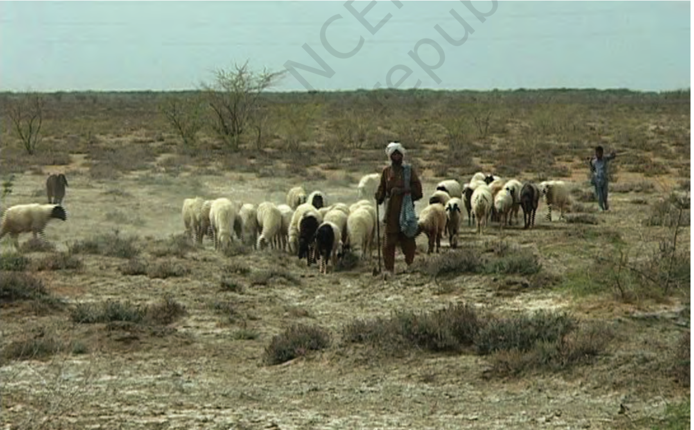
चित्र 10 - चरागाहों की तलाश में निकले मालधारी चरवाहे। उनके गाँव कच्छ की रन में स्थित हैं।

वंशावली बताने वाला समुदाय का इतिहास बताता है। इस तरह की मौखिक परंपराओं से चरवाहा समुदायों को अपनी पहचान का भाव मिलता है। इन परंपराओं से हम यह पता लगा सकते हैं कि कोई समूह अपने अतीत को किस तरह देखता है।