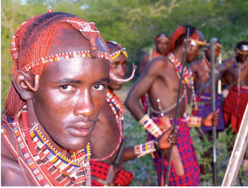
चित्र 17 - आज भी योद्धा बनने के लिए युवकों को व्यापक अनुष्ठानों से गुज़रना पड़ता है हालाँकि अब यह प्रथा पहले जैसी प्रचलित नहीं है। इसके लिए युवकों को लगभग चार माह तक अपने कबीले के इलाके का दौरा करना पड़ता है। इस यात्रा के अंत में वे छापामारों की तरह दौड़कर अपने अहाते में घुसते हैं। इस समारोह के मौके पर युवक ढीले कपड़े पहनते हैं और पूरे दिन नाचते रहते हैं। इस अनुष्ठान के साथ ही वे जीवन के एक नए चरण में पहुँच जाते हैं। लड़कियों को इस तरह के अनुष्ठानों से नहीं गुज़रना पड़ता।

युद्ध में बहादुरी का प्रदर्शन करके अपनी मर्दानगी साबित कर देते थे। फिर भी वे वरिष्ठ जनों के नीचे रह कर ही काम करते थे।