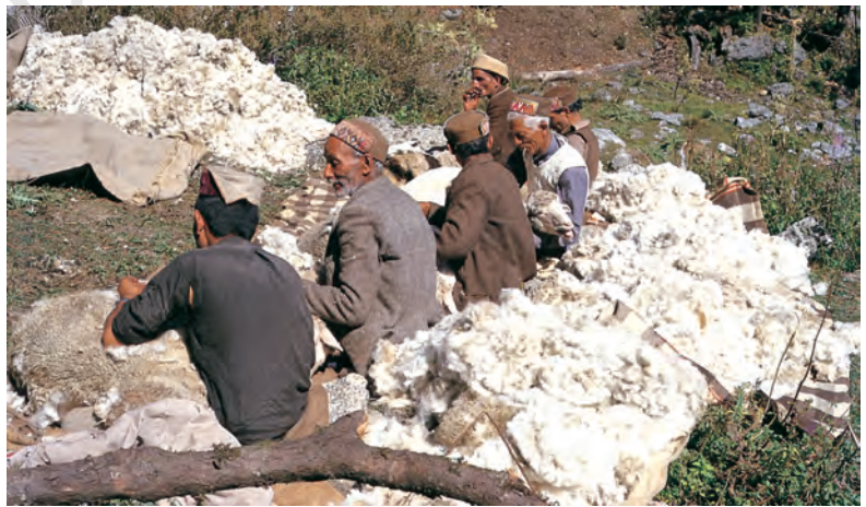
चित्र 4 - गद्दी भेड़ों की ऊन उतार रहे हैं।

भाबर : गढ़वाल और कुमाऊँ के इलाके में पहाड़ियों के निचले हिस्से के आसपास पाए जाने वाला शुष्क या सूखे जंगल का इलाका। बुग्याल : ऊँचे पहाड़ों में स्थित घास के मैदान।