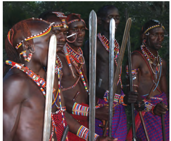
चित्र 16 - योद्धा गहरे लाल रंग की शुका और चमकदार मोतियों के आभूषण पहनते हैं तथा स्टील की नोक वाला पाँच फुट लंबा भाला रखते हैं। बारीकी से सँवारे गए उनके बाल गेरू से रंगे होते हैं। उगत सूरज को सम्मान देने के लिए वे पूर्व की ओर मुँह करके खड़े होते हैं। योद्धा अपने समुदाय की रक्षा करते हैं और लड़के पशुओं को चराते हैं। सूखे के मौसम में योद्धा और लड़के, दोनों ही पशु चराते हैं।

औपनिवेशिक काल में अफ्रीका के बाकी स्थानों की तरह मासाइलैंड में भी आए बदलावों से सारे चरवाहों पर एक जैसा असर नहीं पड़ा। उपनिवेश बनने से पहले मासाई समाज दो सामाजिक श्रेणियों में बँटा हुआ था – वरिष्ठ जन (एल्डर्स) और योद्धा (वॉरियर्स)। वरिष्ठ जन शासन चलाते थे। समुदाय से जुड़े मामलों पर विचार-विमर्श करने और अहम फैसले लेने के लिए वे समय-समय पर सभा करते थे। योद्धाओं में ज्यादातर नौजवान होते थे जिन्हें मुख्य रूप से लड़ाई लड़ने और कबीले की हिफाजत करने के लिए तैयार किया जाता था। वे समुदाय की रक्षा करते थे और दूसरे कबीलों के मवेशी छीन कर लाते थे। जहाँ जानवर ही संपत्ति हो वहाँ हमला करके दूसरों के जानवर छीन लेना एक महत्वपूर्ण काम होता था। अलग-अलग चरवाहा समुदायों की ताकत इन्हीं हमलों से तय होती थी। युवाओं को योद्धा वर्ग का हिस्सा तभी माना जाता था जब वे दूसरे समूह के मवेशियों को छीन कर और