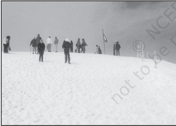
चित्र 7.5 : स्विटजरलैंड में बर्फ से ढकी पर्वत चोटी पर स्कींग करते पर्यटक

पर्यटन एक यात्रा है जो व्यापार की बजाय प्रमोद के उद्देश्यों के लिए की जाती है। कुल पंजीकृत रोजगारों तथा कुल राजस्व (सकल घरेलू उत्पाद का 40 प्रतिशत) की दृष्टि से यह विश्व का अकेला सबसे बड़ा (25 करोड़) तृतीयक क्रियाकलाप बन गया है। इनके अतिरिक्त पर्यटकों के आवास, भोजन, परिवहन, मनोरंजन तथा विशेष दुकानों जैसी सेवा उपलब्ध कराने के लिए अनेक स्थानीय व्यक्तियों को नियुक्त किया जाता है। पर्यटन अवसंरचना उद्योगों, फुटकर व्यापार तथा शिल्प उद्योगों (स्मारिका) को पोषित करता है। कुछ प्रदेशों में पर्यटन ऋतुनिष्ठ होता है क्योंकि अवकाश की अवधि अनुकूल मौसमी दशाओं पर निर्भर करती है, किंतु कई प्रदेश वर्षपर्यंत पर्यटकों को आकर्षित करते हैं।