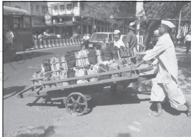
चित्र 7.4 : मुंबई में डब्बावाला सेवा

दैनिक जीवन में काम को सुविधाजनक बनाने के लिए लोगों को व्यक्तिगत सेवाएँ उपलब्ध कराई जाती हैं। कामगार रोजगार की तलाश में ग्रामीण क्षेत्रों से प्रवास करते हैं और अकुशल होते हैं। वे मोची, गृहपाल, खानसामा और माली जैसी घरेलू सेवाओं के लिए नियुक्त किए जाते हैं और इन्हें कम भुगतान किया जाता है। कर्मियों का यह वर्ग असंगठित है। ऐसा एक उदाहरण मुंबई की डब्बावाला सेवा है जो पूरे नगर में लगभग 1,75,000 उपभोक्ताओं को उपलब्ध कराई जाती है।