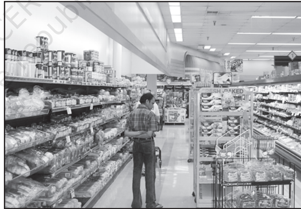
चित्र 7.3 : अमेरिका में डिब्बाबंद आहार बाज़ार

नगरीय बाज़ार केंद्रों में और अधिक विशिष्टीकृत नगरीय सेवाएँ मिलती हैं। इनमें न केवल साधारण वस्तुएँ और सेवाएँ बल्कि लोगों द्वारा वांछित अनेक विशिष्ट वस्तुएँ व सेवाएँ भी उपलब्ध होती हैं। नगरीय केंद्र, इसलिए विनिर्मित पदार्थों के साथ-साथ विशिष्टीकृत बाज़ार भी प्रस्तुत करते हैं जैसे श्रम बाज़ार, आवासन, अर्ध-निर्मित एवं निर्मित उत्पादों का बाज़ार। इनमें शैक्षिक संस्थाओं और व्यावसायिकों की सेवाएँ जैसे— अध्यापक, वकील, परामर्शदाता, चिकित्सक, दाँतों का डॉक्टर और पशु चिकित्सक आदि उपलब्ध होते हैं।