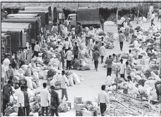
चित्र 7.2 : सब्जियों का थोक बाज़ार

ग्रामीण विपणन केंद्र निकटवर्ती बस्तियों का पोषण करते हैं। ये अर्ध-नगरीय केंद्र होते हैं। ये अत्यंत अल्पवर्धित प्रकार के व्यापारिक केंद्रों के रूप में सेवा करते हैं। यहाँ व्यक्तिगत और व्यावसायिक सेवाएँ सुविकसित नहीं होतीं। ये स्थानीय संग्रहण और वितरण केंद्र होते हैं। इनमें से अधिकांश केंद्रों में मंडियाँ (थोक बाज़ार) और फुटकर व्यापार क्षेत्र भी होते हैं। ये स्वयं में नगरीय केंद्र नहीं हैं किंतु ग्रामीण लोगों की अधिक माँग वाली वस्तुओं और सेवाओं को उपलब्ध कराने वाले महत्वपूर्ण केंद्र हैं।