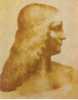
इसाबेला दि इस्ते।