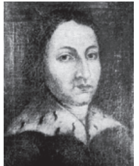
कोपरनिकस का आत्म-चित्र।

खगोलीय का अर्थ दैवी या स्वर्गीय है जबकि पार्थिव में दुनियावी गुण अंतर्निहित है।