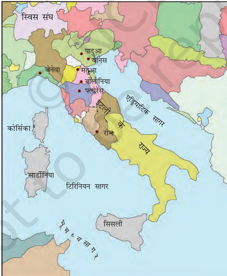
मानचित्र 1 : इटली के राज्य।

बाइज़ेंटाइन साम्राज्य और इस्लामी देशों के बीच व्यापार के बढ़ने से इटली के तटवर्ती बंदरगाह पुनर्जीवित हो गए। बारहवीं शताब्दी से जब मंगोलों ने चीन के साथ 'रेशम-मार्ग' (देखिए विषय 5) से व्यापार आरंभ किया तो इसके कारण पश्चिमी यूरोपीय देशों के व्यापार को बढ़ावा मिला। इसमें इटली के नगरों ने मुख्य भूमिका निभाई। अब वे अपने को एक शक्तिशाली साम्राज्य के अंग