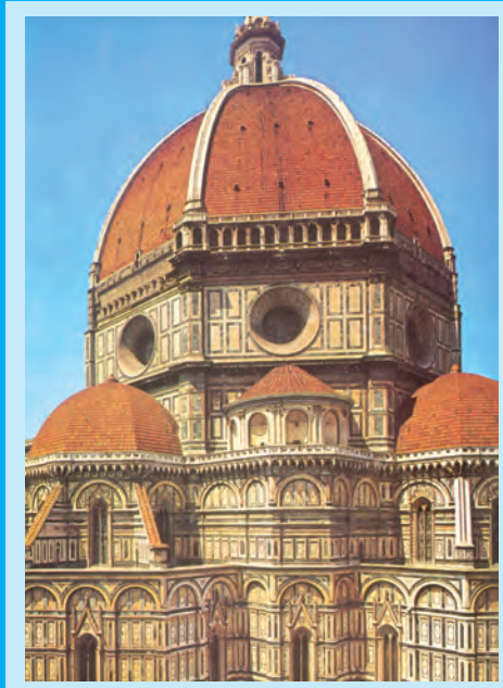
दी ड्युमा (Duomo), फ्लोरेंस के कथीड्रल का गुम्बद, इसका डिजाइन ब्रूनेलेशी ने बनाया।

(Filippo Brunelleschi, 1337-1446) जिन्होंने फ्लोरेंस के भव्य गुम्बद (Duomo) का परिरूप प्रस्तुत किया था, ने अपना पेशा एक मूर्तिकार के रूप में शुरू किया। इस काल में एक और अनोखा बदलाव आया। अब कलाकार की पहचान उसके नाम से होने लगी, न कि पहले की तरह उसके संघ या श्रेणी (गिल्ड) के नाम से।