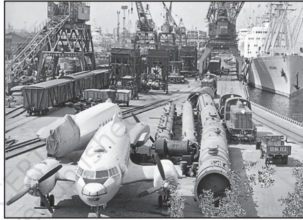
चित्र 9.5 : लेनिनग्राद का वाणिज्यिक पत्तन