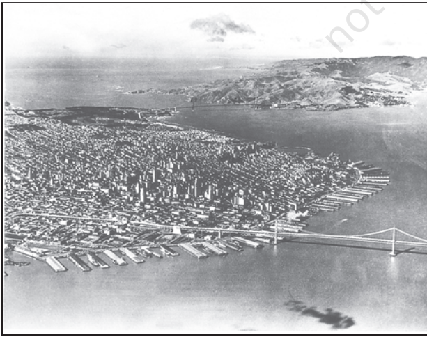
चित्र 9.4 : सैन फ्रांसिस्को, विश्व का सबसे बड़ा स्थलरुद्ध पत्तन

पत्तन जहाज़ के लिए गोदी, लादने, उतारने तथा भंडारण हेतु सुविधाएँ प्रदान करते हैं। इन सुविधाओं को प्रदान करने के उद्देश्य से पत्तन के प्राधिकारी नौगम्य द्वारों का रख-रखाव, रस्सों व बजरों (छोटी अतिरिक्त नौकाएँ) की व्यवस्था करने और श्रम एवं प्रबंधकीय सेवाओं को उपलब्ध कराने की व्यवस्था करते हैं। एक पत्तन के महत्त्व को नौभार के आकार और निपटान किए गए जहाज़ों की संख्या द्वारा निश्चित किया जाता है। एक पत्तन द्वारा निपटाया नौभार, उसके पृष्ठ प्रदेश के विकास के स्तर का सूचक है।