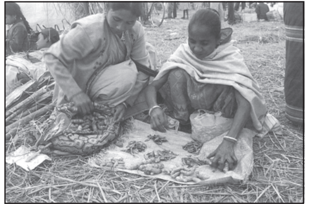
चित्र संख्या 9.1 : जॉन बीलमेला में वस्तुओं का आदान-प्रदान करती दो महिलाएँ

आदिम समाज में व्यापार का आरंभिक स्वरूप 'विनिमय व्यवस्था' था, जिसमें वस्तुओं का प्रत्यक्ष आदान-प्रदान होता था अर्थात् वस्तु के बदले में रुपये के स्थान पर वस्तु दी जाती थी। इस व्यवस्था में यदि आप एक कुम्हार होते और आपको एक नलसाज की आवश्यकता होती, तो आपको एक ऐसा नलसाज ढूँढ़ना पड़ता, जिसे आप द्वारा बनाए हुए बर्तनों की आवश्यकता होती और आप उसकी नलसाज की सेवाओं के बदले अपने बर्तन देकर आदान-प्रदान कर सकते थे।