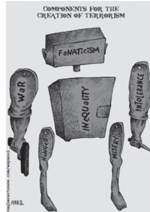
आतंकवाद के जन्म के कारण

संयुक्त राष्ट्र शैक्षणिक, वैज्ञानिक एवं सांस्कृतिक संगठन (यूनिसेफ) के संविधान ने उचित ही टिप्पणी की है कि, “चूँकि युद्ध का आरंभ