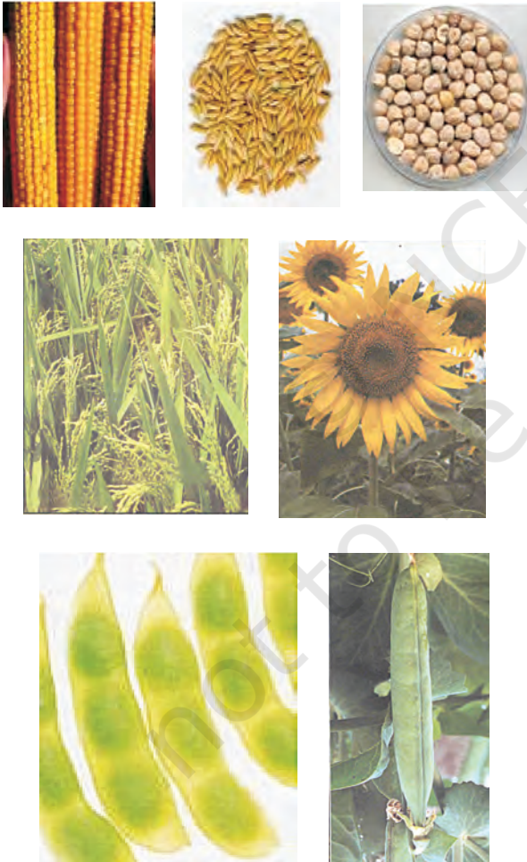
चित्र 15.1: विभिन्न प्रकार की फसलें

ऊर्जा की आवश्यकता के लिए अनाज; जैसे-गेहूँ, चावल, मक्का, बाजरा तथा ज्वार से कार्बोहाइड्रेट प्राप्त होता है। दालें जैसे चना, मटर, उड़द, मूँग, अरहर, मसूर से प्रोटीन प्राप्त होती है और तेल वाले बीजों; जैसे-सोयाबीन, मूँगफली, तिल, अरंड, सरसों, अलसी तथा सूरजमुखी से हमें आवश्यक वसा प्राप्त होती है (चित्र 15.1)। सब्जियाँ, मसाले तथा फलों से हमें विटामिन तथा खनिज लवण, कुछ मात्रा में प्रोटीन, वसा तथा कार्बोहाइड्रेट भी प्राप्त होते हैं। चारा फसलें; जैसे-वर्सीम, जई अथवा सूडान घास का उत्पादन पशुधन के चारे के रूप में किया जाता है।