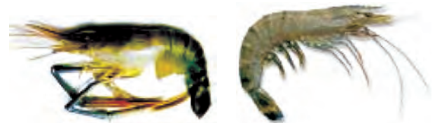
मेक्रोब्रेकियम रोजेन वर्गी (ताजा पानी)

भविष्य में समुद्री मछलियों का भंडार (stock) कम होने की अवस्था में इन मछलियों की पूर्ति संवर्धन के द्वारा हो सकती है। इस प्रणाली को समुद्री संवर्धन (मेरीकल्चर) कहते हैं।