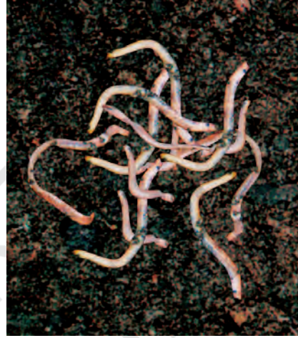
चित्र 16.4 लाल केंचुए

कुछ जल छिड़क कर इस परत को नम बनाइए। ध्यान रहे कि जल इतना अधिक न हो कि वह बहने लगे। अपशिष्ट की परत को दबाइए नहीं इसे पोला ही रहने दीजिए ताकि इस परत में पर्याप्त मात्रा में वायु एवं नमी बनी रहे।