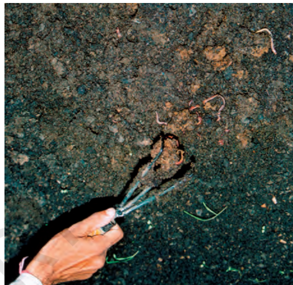
चित्र 16.6 वर्मीकंपोस्टिंग

गड्ढे के इस बचे भाग में अधिकांश कृमि हैं। आप इनका उपयोग और अधिक कंपोस्ट बनाने में कर सकते हैं अथवा आप इन्हें किसी कंपोस्ट बनाने वाले को बाँट सकते हैं।