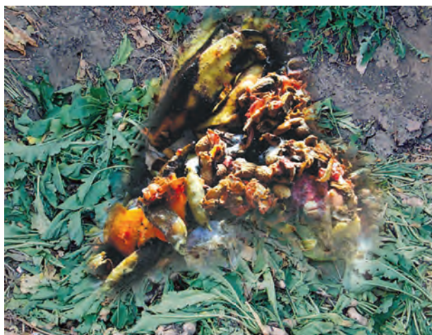
चित्र 16.5 लाल केंचुओं के लिए आहार

लाल केंचुए के दाँत नहीं होते। इनमें एक विशेष संरचना होती है जिसे 'गिजर्ड' कहते हैं जो भोजन को पीसने में इनकी सहायता करता है। यदि आप अंडे के छिलके अथवा समुद्री शंख या सीपी का चूरा आहार के साथ मिला देंगे तो यह आहार के साथ कृमि के गिजर्ड में पहुँच जाता है और भोजन को पीसने में उसकी सहायता करता है। कोई लाल कृमि एक दिन में अपने शरीर के भार के बराबर, आहार खा सकता है।