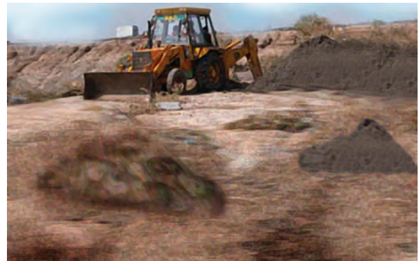
चित्र 16.1 भराव क्षेत्र

वहाँ कचरे के उस भाग को जिसका पुनः उपयोग किया जा सकता है, उसी रूप में उपयोग न किए जा सकने वाले कचरे से पृथक किया जाता है। इस प्रकार