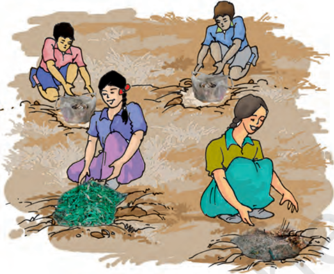
चित्र 16.2 कचरे की ढेरियों को गड्डों में भरना

कचरे में उपयोगी और अनुपयोगी दोनों अवयव होते हैं। अनुपयोगी अवयव को पृथक कर लेते हैं और फिर इसे भराव क्षेत्र में फैलाकर मिट्टी की परत से ढक देते हैं। जब यह भराव क्षेत्र पूरी तरह से भर जाता है, तब प्रायः इस पर पार्क अथवा खेल का मैदान बना देते हैं। लगभग अगले 20 वर्षों तक इस पर कोई भवन निर्माण नहीं किया जाता। कचरे के उपयोगी अवयव के निपटान के लिए भराव क्षेत्रों के पास कंपोस्ट बनाने वाले क्षेत्र विकसित किए जाते हैं। कंपोस्ट क्या है? आइए, इसे निम्नलिखित क्रियाकलाप द्वारा सीखें।