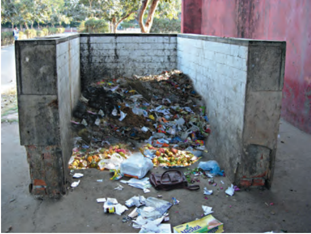
चित्र 16.7 निकटवर्ती कूड़ाघर

जानते हैं। यदि आप अपने शहर अथवा नगर की जनसंख्या का पता लगा लें तो क्या अब आप यह अनुमान लगा सकते हैं कि प्रतिदिन आपके मोहल्ले अथवा नगर के सभी घरों में कितनी बाल्टी कचरा उत्पन्न होगा? हम प्रतिदिन कचरे के पहाड़ उत्पन्न कर रहे हैं, क्या यह सच नहीं है (चित्र 16.7)?