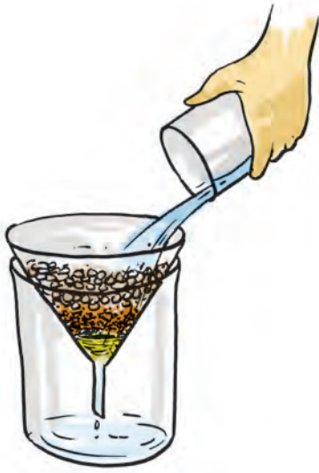
चित्र 18.2 वातित द्रव को फ़िल्टर करने का प्रक्रम