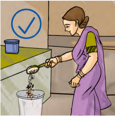
चित्र 18.7 हर कचरे को सिंक में मत फेंकिए

मल, स्वास्थ्य संकट का एक कारक है। इससे जल और मृदा का प्रदूषण हो सकता है। सतह पर उपलब्ध जल और भौमजल दोनों मानव मल से प्रदूषित हो जाते हैं। 'भौमजल' कुँओं, ट्यूबवैल (नलकूपों), झरनों और अनेक नदियों के लिए जल का स्रोत है, जैसा कि आपने अध्याय 16 में पढ़ा था। अतः अनुपचारित मानव मल, जल जनित रोगों का सबसे सुगम पथ बन जाता