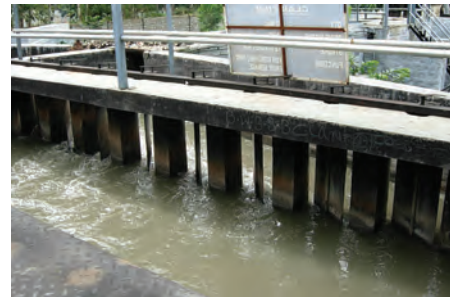
चित्र 18.4 ग्रिट और बालू अलग करने की टंकी