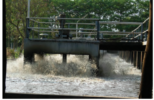
चित्र 18.6 वात्रि

कई घंटों के पश्चात् जल में निलंबित सूक्ष्मजीव टंकी की पेंदी में सक्रिय आपंक के रूप में बैठ जाते हैं। अब शीर्ष भाग से जल को निकाल दिया जाता है। सक्रिय आपंक लगभग 97% जल है। जल को बालू बिछाकर बनाए शुष्कन तलों अथवा मशीनों द्वारा हटा दिया जाता है। शुष्क आपंक का उपयोग खाद के रूप में किया जाता है, जिससे कार्बनिक पदार्थ और पोषक तत्व पुनः मृदा में वापस चले जाते हैं।