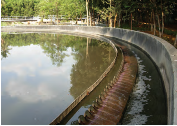
चित्र 18.5 जल अपमथित्र

आपंक को एक पृथक् टंकी में स्थानांतरित किया जाता है, जहाँ यह अवायवीय जीवाणुओं द्वारा अपघटित हो जाता है। इस प्रक्रम में उत्पन्न होने वाली बायोगैस (जैव गैस) का उपयोग ईंधन के रूप में अथवा विद्युत उत्पादन के लिए किया जा सकता है।