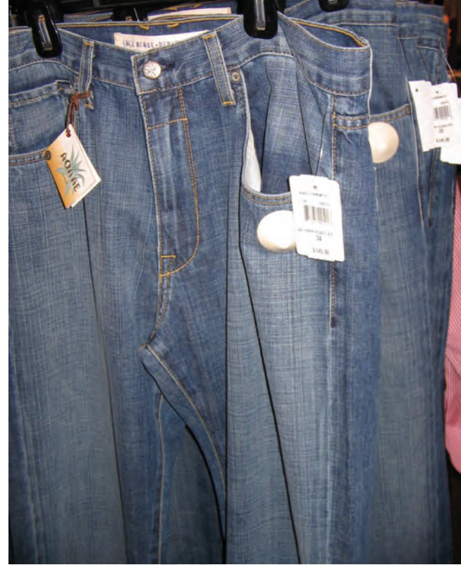
विकासशील देशों में उत्पादित जीन्स अमेरिका में 6500 रु. में बेची जा रही है।

छोटे उत्पादकों द्वारा उत्पादन किया जाता है। बहुराष्ट्रीय कंपनियों को इन उत्पादों की आपूर्ति की जाती है। फिर इन्हें अपने ब्राण्ड नाम से ग्राहकों को बेचती हैं। इन बड़ी कंपनियों में दूरस्थ उत्पादकों के मूल्य, गुणवत्ता, आपूर्ति और श्रम-शर्तों का निर्धारण करने की प्रचण्ड क्षमता होती है।