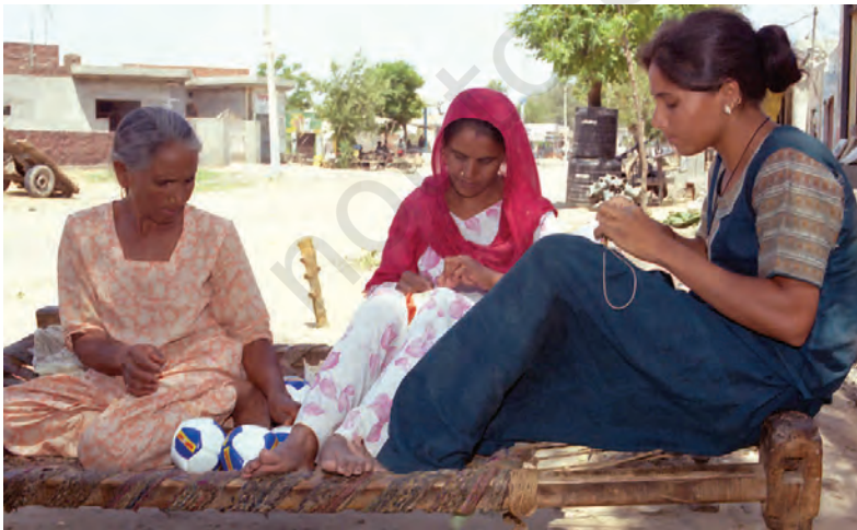
लुधियाना के एक घर में एक बड़ी बहुराष्ट्रीय कंपनी के लिए फुटबाल-निर्माण का चित्र

बहुराष्ट्रीय कंपनियाँ एक अन्य तरीके से उत्पादन नियंत्रित करती हैं। विकसित देशों की बड़ी बहुराष्ट्रीय कंपनियाँ छोटे उत्पादकों को उत्पादन का ऑर्डर देती हैं। वस्त्र, जूते-चप्पल एवं खेल के सामान ऐसे उद्योग हैं, जहाँ विश्वभर में बड़ी संख्या में