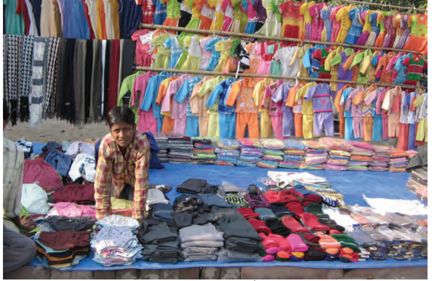
सिलेसिलाए वस्त्रों के छोटे व्यापारी बहुराष्ट्रीय कंपनियों के ब्रांड और आयात दोनों से कड़ी प्रतिस्पर्धा का सामना करते हुए।

सामान्यतः व्यापार के खुलने से वस्तुओं का एक बाज़ार से दूसरे बाज़ार में आवागमन होता है। बाज़ार में वस्तुओं के विकल्प बढ़ जाते हैं। दो बाज़ारों में एक ही वस्तु का मूल्य एक समान होने लगता है। अब दो देशों के उत्पादक एक दूसरे से हजारों मील दूर होकर भी एक दूसरे से प्रतिस्पर्धा कर सकते हैं। इस प्रकार, विदेश व्यापार विभिन्न देशों के बाज़ारों को जोड़ने या एकीकरण में सहायक होता है।