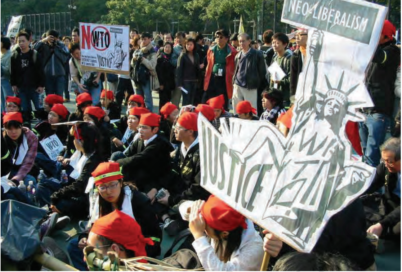
हांगकांग में डब्लू.टी.ओ. के खिलाफ प्रदर्शन-2005