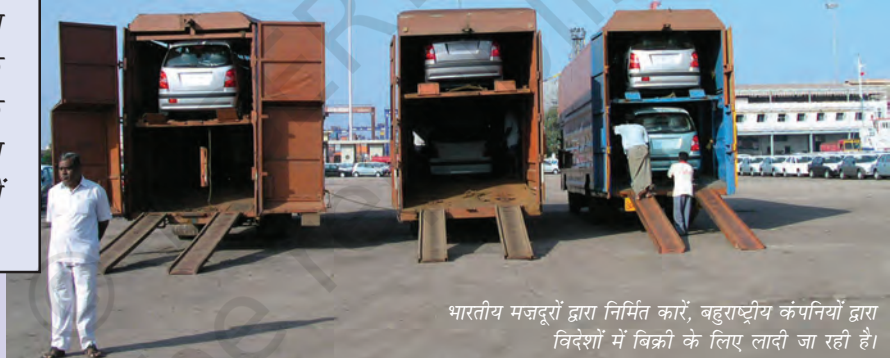
भारतीय मजदूरों द्वारा निर्मित कारें, बहुराष्ट्रीय कंपनियों द्वारा विदेशों में बिक्री के लिए लादी जा रही हैं।