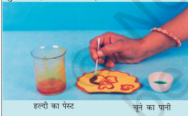
हल्दी का पेस्ट

आप अपनी माताजी के जन्मदिन पर, उनके लिए विशेष बधाई पत्र बना सकते हैं। सादे सफेद कागज़ की शीट पर हल्दी का पेस्ट लगाइए और उसे सुखा लीजिए। रुई के फाहे की सहायता से इस पर चूने के पानी से एक खूबसूरत फूल बनाइए। आपको एक सुंदर बधाई पत्र मिल जाएगा।