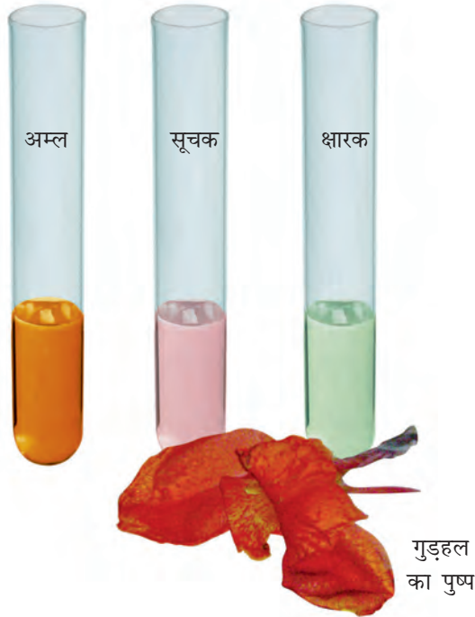
चित्र 5.3 गुड़हल का पुष्प और उससे तैयार किया गया सूचक

आप इन प्राकृतिक सूचकों को बनाकर उनसे अम्लीय, क्षारकीय और उदासीन विलयनों में रंग परिवर्तन देखने का प्रयास कर सकते हैं।