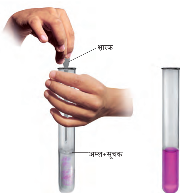
चित्र 5.4 उदासीनीकरण का प्रक्रम

(चित्र 5.4)। परखनली को धीरे-धीरे हिलाइए। क्या आपको अम्ल के रंग में कोई परिवर्तन दिखाई देता है?