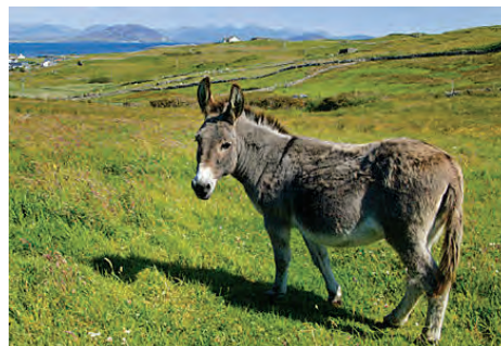
चित्र 9.2 खच्चर

के वांछनीय गुण सम्मिलित हो जाते हैं तथा इस संतति का पर्याप्त आर्थिक महत्त्व होता है; जैसे- खच्चर (चित्र 9.2)। क्या आप जानते हैं कि खच्चर की उत्पत्ति किस संकरण का परिणाम है?